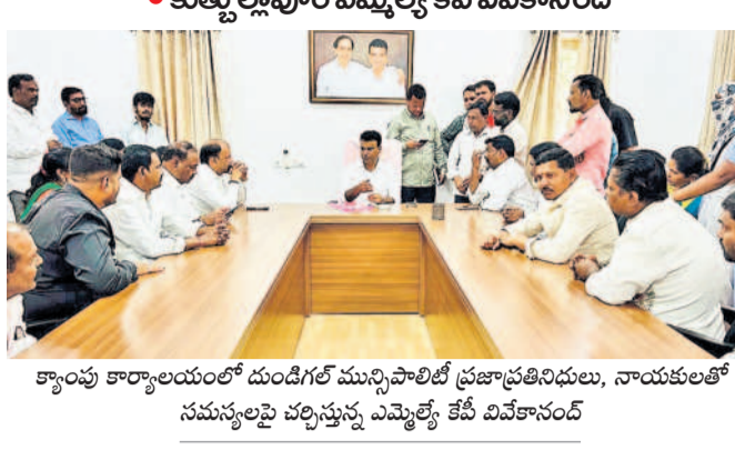
'డబుల్' ఇండ్లలో సౌకర్యాలు కల్పిస్తాం..

'డబుల్' ఇండ్లలో సౌకర్యాలు కల్పిస్తాం.. కుత్బుల్లాపూర్లో 'డబుల్' ఇండ్లలో సౌకర్యాలు కల్పిస్తాం..