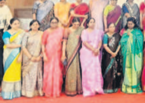
ఘనంగా మహిళా ఉపాధ్యాయ దినోత్సవం

ఘనంగా మహిళా ఉపాధ్యాయ దినోత్సవం. ఘనంగా మహిళా ఉపాధ్యాయ దినోత్సవం.