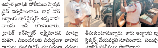
ఉప్పల్ లింగ్ రోడ్డులో స్పెషల్ డ్రైవ్

ఉప్పల్ లింగ్ రోడ్డులో స్పెషల్ డ్రైవ్. ఉప్పల్ లింగ్ రోడ్డులో స్పెషల్ డ్రైవ్.