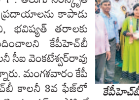
మన సంస్కృతి సంప్రదాయాలను కాపాడుకోవాలి

మన సంస్కృతి సంప్రదాయాలను కాపాడుకోవాలి. మన సంస్కృతి సంప్రదాయాలను కాపాడుకోవాలి.