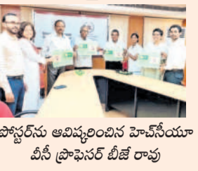
హెచ్ఎస్యూలో హెచ్ఎంపీపీపై అవగాహన

హెచ్ఎస్యూలో హెచ్ఎంపీపీపై అవగాహన సభలు నిర్వహించారు. హెచ్ఎంపీపీపై అవగాహన సభలు నిర్వహించారు. హెచ్ఎంపీపీపై అవగాహన సభలు నిర్వహించారు.