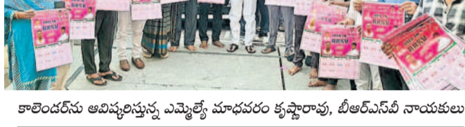
బీఆర్ఎస్ పోలింగ్ క్యాలెండర్ ఆవిష్కరణ

బీఆర్ఎస్ పోలింగ్ క్యాలెండర్ ఆవిష్కరణ. బీఆర్ఎస్ పోలింగ్ క్యాలెండర్ ఆవిష్కరణ.