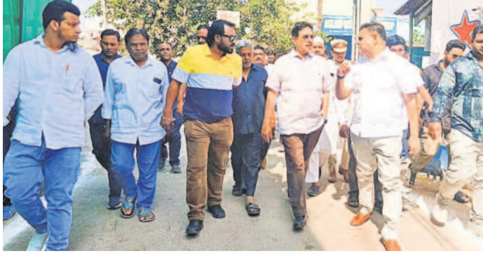
పాత మలక్పేట డివిజన్లోని శంకరనగర్ బస్స్లో పర్యటిస్తున్న మలక్పేట ఎమ్మెల్యే అపూర్వ దీప్ అబ్దుల్లా బలాల, అధికారులు

మలక్పేట, జనవరి 7 : పాత మలక్పేట డివిజన్లోని శంకరనగర్ బస్స్లో మెరుగైన వసతులు కల్పించునున్నట్లు మలక్పేట ఎమ్మెల్యే అపూర్వ దీప్ అబ్దుల్లా బలాల అన్నారు. జీహెచ్ఎంసీ వివిధ శాఖల అధికారులతో కలిసి మంగళవారం బస్లో పర్యటింపిన ఆయన.. బస్టివాసులను అడిగి సమస్యలను తెలుసుకున్నారు. ఈ సందర్భంగా ఆయన మాట్లాడుతూ, మానసి ఆసుకొని ఉన్న శంకరనగర్లో రోడ్లు, డ్రైనేజీ, తాగునీటి వసతి, విద్యుత్ సౌకర్యాలు, కమ్యూనిటీహాల్, బస్టి దళా ఖాస వంటి వసతులు కల్పించడం జరిగిందని తెలిపారు. అదనంబ్రతక తావులేకుండా దోస చర్మలు తీసుకుంటామని, ఈగలు, టోమల వ్యాప్తి జరిగకుండా లార్కా నిర్మాణం కోసం రసాయనాలు పికికారి చేయించడం జరుగుతున్నట్లు తెలిపారు.