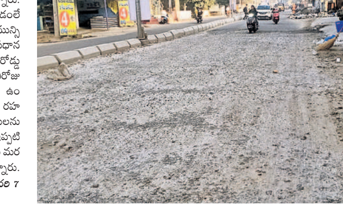
- బడంపేట, జనవరి 7

కంకరేపల్లి గుంతలమయంగా మారిన రోడ్లతో వాహనదారులు తీవ్ర ఇబ్బందులు పడుతున్నారు. అయినా సంబంధిత అధికారులు స్పందించడంలే దని పలువురు వాపోతున్నారు. మీరపేట మున్సిపల్ కార్పొరేషన్ పరిధిలోని రెవెన్యూ నగర్ ప్రధాన రహదారి అధ్వానంగా మారింది. అసలు రోడ్డు ఇరుకు.. అట్ట గుంతల మయం.. డింట్ ప్రతిరోజూ ఈ రోడ్లపై ప్రయాణించాలంటే సరకంగా ఉంటుంది.. స్థానిక ఎమ్మెల్యే సుబితా ఇంద్రారెడ్డి.. రహదారికి మరమ్మతులు చేపట్టాలని అధికారులను ఆదేశించినా వారు పట్టించుకోవడంలేదు. ఇప్పటికే శివారాజు అధికారులు స్పందించి ఈ రోడ్లపై మరమ్మతులు చేపట్టాలని స్థానికులు కోరుతున్నారు.