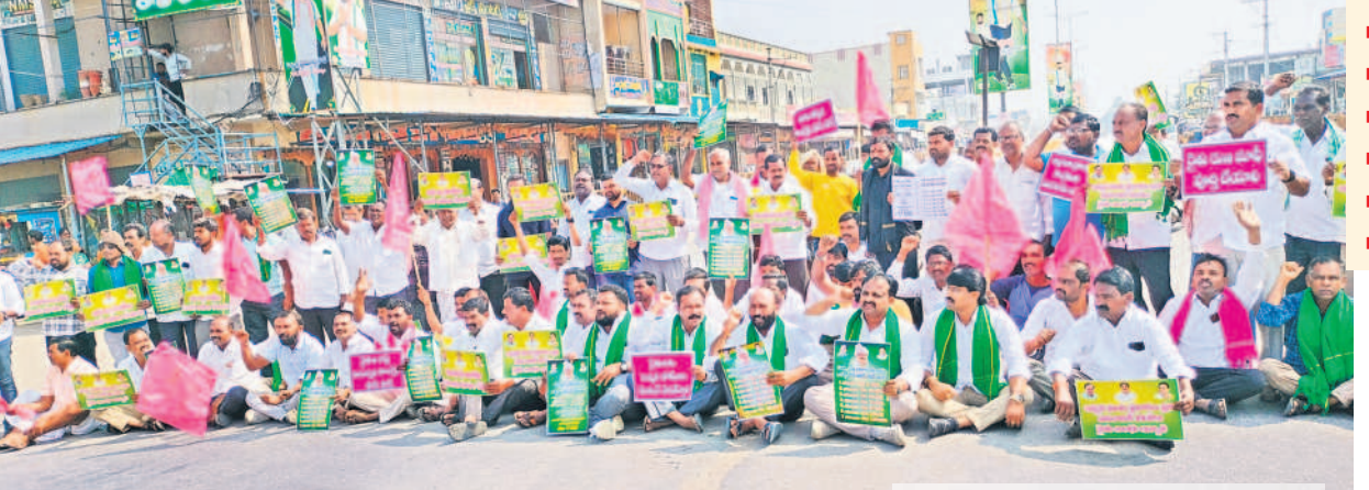
దేవరపల్లె : జాతీయ రహదారిపై బైకాపాపని బీఆర్ఎస్ నాయకులు, కార్యకర్తలు