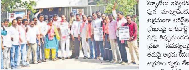
కేయి పోలీస్ స్టేషన్లో నిరసన తెలుపుతున్న దాస్యం

హనుమకొండ, జనవరి 6 : కాంగ్రెస్ ప్రభుత్వం నిరసన తెలుపుతున్న దాస్యం కాదు. రాష్ట్రంలో ప్రతికార, నిర్బంధ, నిరంకుశ పాలన కొనసాగుతున్నదని దాస్యం మండిపడ్డారు. కానీస్టేబుల్ మొదలు ఎస్ఐ, సీబి, ఏసీబీ స్థాయి వరకు పోలీస్ కార్యాలయం వద్ద పహారా కాని ఆలక మంగా అరెస్ట్ చేయడంపై పోలీసులు, ప్రభుత్వంపై ఆగ్రహం వ్యక్తం చేశారు. ఇచ్చిన హామీలు అమలు చేయడంపై ఆగ్రహం అరెస్ట్ చేయడమేమిటని ప్రశ్నించారు. 6 గ్యారంటీలు, 420 హామీలు ఇచ్చిన కాంగ్రెస్ ఏడాది పాటికొండ రాష్ట్ర ప్రజలకు చేసిన అపరాధం వరకు వరంగల్ వేదికగా రైతు డిక్లరేషన్ ప్రకటింపి ఇవాళ రైతుభ