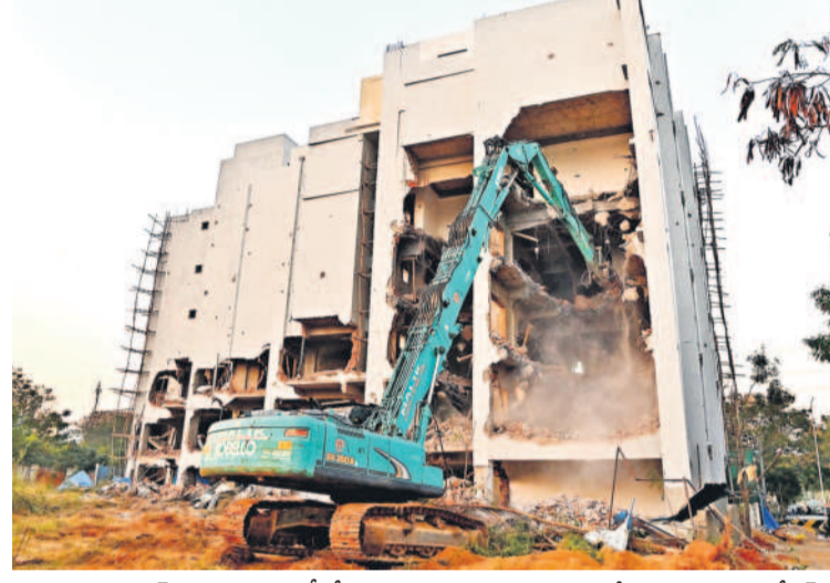
మాదాపూర్ అయ్యప్ప సానైటిలోని ఏడంతస్తుల భవనాన్ని కూల్చివేస్తున్న హైద్రా బుల్డోజర్

హైదరాబాద్ సీటీఎమ్/మాదాపూర్, జనవరి 5 (నమస్తే తెలంగాణ): మాదాపూర్ అయ్యప్ప సానైటిలో హైద్రా బాబులబి బుల్డోజర్ హతాభవం చేసింది. సానైటిలోని ఏడంతస్తుల భవనాన్ని ఆదివారం కూల్చివేసింది. కేరళీగంపల్లి మండలం ఖానా మెట్ గ్రామం మాదాపూర్ అయ్యప్ప సానైటిలోని సర్వే నంబర్ 11/5లో ఫ్లాట్ నంబర్ 5/13 పేరిట 684 గజాల స్థలంలో 100 ప్లీట్ రోడ్డుకు అనుకూల చేపట్టిన ఏడంతస్తుల (సెల్లార్ నుంచి జే ఫ్లోర్ 5) భవనాన్ని హైద్రా, జీవోఎంసీ అధికారులు నేలమట్టం చేయించారు. జీవోఎంసీ నోటీసులు, హైకోర్టు ఉత్తర్వులను ఖాతరుచేయకుండా సెల్లార్, గ్రౌండ్ ఫ్లోర్ సహా ఏడంతస్తులు నిర్మించడంపై స్టానికల ఫిర్యాదు మేరకు కూల్చివేసినట్లు హైద్రా అధికారులు తెలిపారు. కూల్చివేత నేపథ్యంలో భవనం వద్ద భారీగా పోలీసులు, హైద్రా డిఆర్ఎఫ్ సిబ్బందీని మోహరించారు. శనివారం హైద్రా కమిషనర్ రంగనాథ్ స్టానికల అధికారులతో కలిసి భవనాన్ని పరిశీలించారు. ఎలాంటి సెట్ బ్యాక్ వదలకుండా, పార్లొంగ్ సౌకర్యం, ఫైర్ సేఫ్టీ షాగ్రడ్లు తీసుకోకుండా సెల్లార్ లోనే కిచెన్ నిర్మాణానికి ఏర్పాట్లు చేయడాన్ని తీవ్రంగా పరిగణించారు. భవనం యజమానులు ఎవరి ఉత్తరవులనూ లెక్కచేయకుండా అక్రమంగా నిర్మిస్తున్నారని మండిపడ్డారు. వెంటనే భవనాన్ని కూల్చివేయాలని జీవోఎంసీతోపాటు కలిసి హైద్రా బృందాన్ని ఆదేశించారు. దీంతో హైద్రా బృందం ఆదివారం ఉదయమే అయ్యప్ప సానైటికి చేరుకోవని మొదట సాధారణ క్రేన్ తో కూల్చివేతలు ప్రారంభించింది. మున్నూరుకాపుల సమయంలో బాబులబి బుల్డోజర్ వచ్చి నేలమట్టం చేసింది. కాగా ఎలాంటి అను