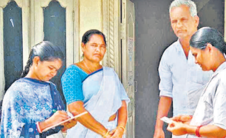
మల్లగూడ మండలంలో సర్వే చేస్తున్న ఆరోగ్య సిబ్బంది

నివారణ గతంలో ఉన్నంత పెద్ద సమస్యగా ఉండక పోవచ్చని వైద్యాధికారులు పేర్కొంటున్నారు.