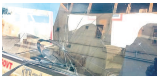
పగిలిన అటవీ వాహన అద్దం