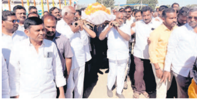
పాడె మోసిన మాజీ మంత్రి కో. రామన్న, నాయకులు