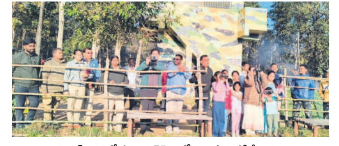
కవ్వాల అడవులో పక్షులను కెమెరాలో బంధిస్తున్న పక్షి ప్రేమికులు