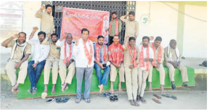
నిరసన వ్యక్తం చేస్తున్న హమాళీలు