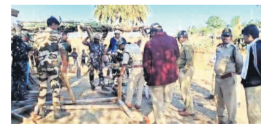
కేశవపట్నంలో కార్లను నిర్వహిస్తున్న అటవీ శాఖ సిబ్బంది

అధికారులు వెళ్లడంతో గ్రామస్థులు భయపడ్డారని, దీంతో ముద్ద వాతావరణం నెలకొన్నాయి. అధికారులకు ఎటువంటి గాయాల కాలేదన్నారు. 20 మంది స్వగర్జన గుర్తించడం జరిగిందన్నారు. ముఖ్యంగా జగడ సందర్భంగా ఆయన మాట్లాడుతూ.. జగడ ఉద్ధార వేడివే రేపంత చంద్ర అధ్యక్షులతో దాడి చేసి నిల్వ ఉన్న కలపను పట్టుకున్నామన్నారు. స్వాధీనం చేసుకున్న కలపను ముందు దాదాపు రూ.3.50 లక్షలు ఉంటుంది అని తెలిపారు. గ్రామంలోకి అటవీ శాఖ