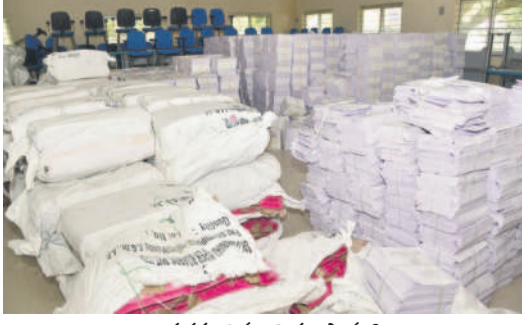
భద్రపరిచిన ఎన్నికల సామగ్రి

పంచాయతీ ఎన్నికలకు విడుదల చేసిన పాఠశాల నిర్వహించే అవకాశమున్నట్లు తెలుస్తుండగా, అందుకునుగుణంగా అధికారులు శిక్షణ శిబిరాలు కూడా ఏర్పాటు చేసేందుకు సమాయత్తమవుతున్నారు. స్టేజీ 1, స్టేజీ 2 స్థాయి అధికారులను కూడా నియమించి, వారికి క్లస్టర్ బాధ్యతలు అప్పగించేలా చర్యలు తీసుకుంటున్నారు. ఒక్కో క్లస్టర్లో ఆరు గ్రామ పంచాయతీలను చేర్చి, ఆరు జిల్లాలలో పోటీ చేసే అభ్యర్థులకు సంబంధించి అధికారులను నామినేషన్లు స్వీకరించేలా, గుర్తుల కేటాయింపు చేపట్టేలా శిక్షణ ఇవ్వనున్నారు. ఎన్నికల ప్రక్రియ మొత్తం వీరి ఆధ్వర్యంలోనే పూర్తి చేసేలా ఆదేశాలు వచ్చినట్లు అధికారులు చెబుతున్నారు. క్లస్టర్ అధికారులుగా జిల్లా స్థాయి అధికారులను నియమించేందుకు కనీసం 25 మందిని నామినేషన్లు చేస్తున్నారు. వీరితో పాటు ప్రిన్సిపాల్, అదనపు ప్రిన్సిపాల్, ఇంజనీరింగ్ ఇంజనీరింగ్ కార్యాలయంలో ఉన్న వారందరినీ శిక్షణ ఇవ్వనున్నారు. ఆయా పంచాయతీలకు సరిపడేలా బ్యాటిల్లు