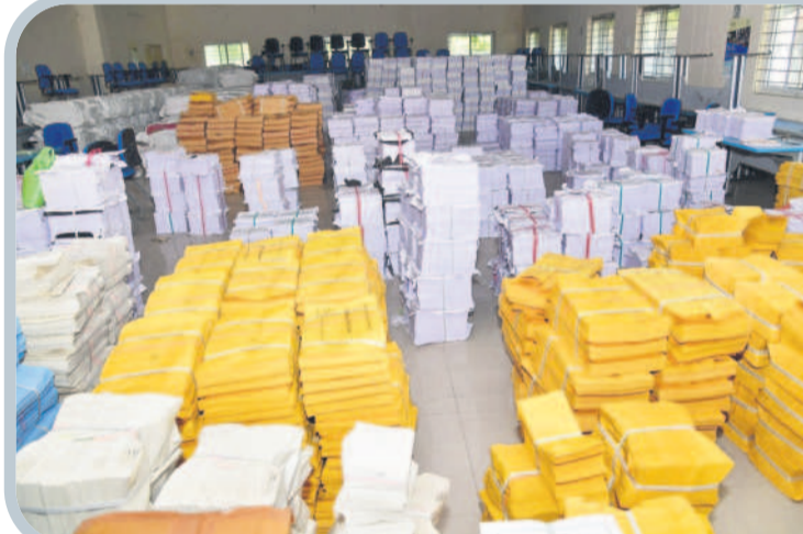
కరీంనగర్ జిల్లా పంచాయతీరాజ్ శాఖ ఇంజనీరింగ్ విభాగం కార్యాలయంలో భద్రపరిచిన గ్రామపంచాయతీ ఎన్నికల సామగ్రి