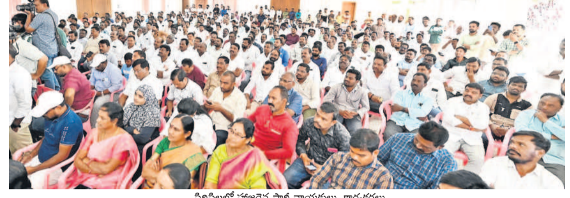
సీనియర్లలో హాజరైన పార్టీ నాయకులు, కార్యకర్తలు