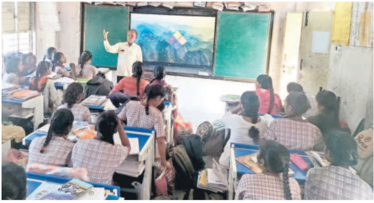
కాల్యాణిరాంపూర్ కేజీబీపీలో విద్యార్థినులకు బోధిస్తున్న ఉపాధ్యాయుడు

పెద్దపల్లి, జనవరి 4 (నమస్తే తెలంగాణ) : కస్తూర్బా గాంధీ విద్యాలయాల్లో కొత్త చిచ్చు మొదలైంది. డిప్యూటీవీసై ప్రభుత్వ స్కూళ్ల టీచర్ల రావడంతో ఆగ్రహం వ్యక్తమవుతున్నది. కేజీబీపీలో పనిచేసే టీచర్లు, నాన్ టీచర్లు సిబ్బంది తమ డిమాండ్ల సాధనకు 25 రోజులు నిరవధిక సమ్మె చేస్తున్న విషయం తెలిసింది. అయితే చదువులకు అటంకం ఏర్పడుతుండడం, వాళ్లకు పక్కలు దగ్గర చదువుకు ఉండడం విద్యార్థినులు, తల్లిదండ్రుల్లో ఆందోళన వ్యక్తమైంది. ఈ నేపథ్యంలో సమీప ప్రభుత్వ పాఠశాలల్లో పనిచేస్తున్న ఉపాధ్యాయులను డిప్యూటీవీసై పంపించాలని సర్కారు నిర్ణయించి ఉత్తర్వులు జారీ చేయడంతో నిరసన వ్యక్తమవుతున్నది. దీంతో సమ్మెకు దిగిన సర్వ శిక్షా ఉద్యోగులు అగ్రిమెంట్ గుర్తించి అవుతున్నారు. తమ న్యాయమైన డిమాండ్లపై స్పందించకపోవడం ఏంటని ప్రశ్నిస్తున్నారు. ఇప్పటి వరకు తాము సమ్మెలో ఉన్నా ఒకరిద్దరు కేజీబీపీలో ఉంటున్నారని, ప్రభుత్వ టీచర్లు బోధించి వెళ్లే ఎవరు ఉంటారని ప్రశ్నిస్తున్నారు. తాము సమ్మెలో ఉన్నా.. విద్యార్థులకు ఎలాంటి ఇబ్బందులు కలుగుతూ ఉన్నాయో కేజీబీపీను కాపాడుకోవాలనే ఉద్దేశంతో ఇప్పటి వరకు ఒక్కో కేజీబీపీలో ఒకరు, ఇద్దరు ఉండి సంరక్షిస్తున్నారన్నారు. ఇక కేజీబీపీలకు తాళాలు వేసి ఎంఈవోలకు అప్పగిస్తామని స్పష్టం చేస్తున్నారు. ప్రభుత్వ పాఠశాలల నుంచి ఉపాధ్యాయులను పంపిస్తే అక్కడ సైతం సమ్మెపోయే ప్రమాదముందని, ప్రభుత్వం ఇప్పటికే సర్కారును విడిచిపెట్టేందుకు సిద్ధమవుతున్నారన్నారు.