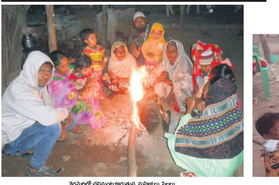
కెరమెలలో చరిమంల కారుతున్న మహిళలు, పిల్లలు