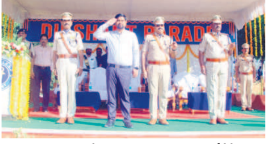
గౌరవ వందనం స్వీకరిస్తున్న కలెక్టర్, కమాండెంట్, డి.పీ.సి