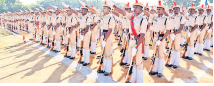
ప్రతిజ్ఞ చేస్తున్న కానిస్టేబుళ్లు