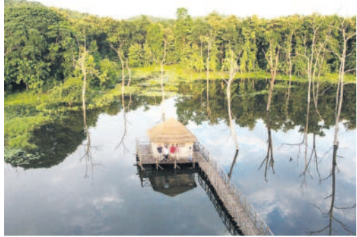
ఇందనీపల్లి రేంజ్లోని ఘనశిల్పికుంట్ల