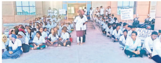
ధర్మా చేస్తున్న మెడికల్ కళాశాల విద్యార్థులు