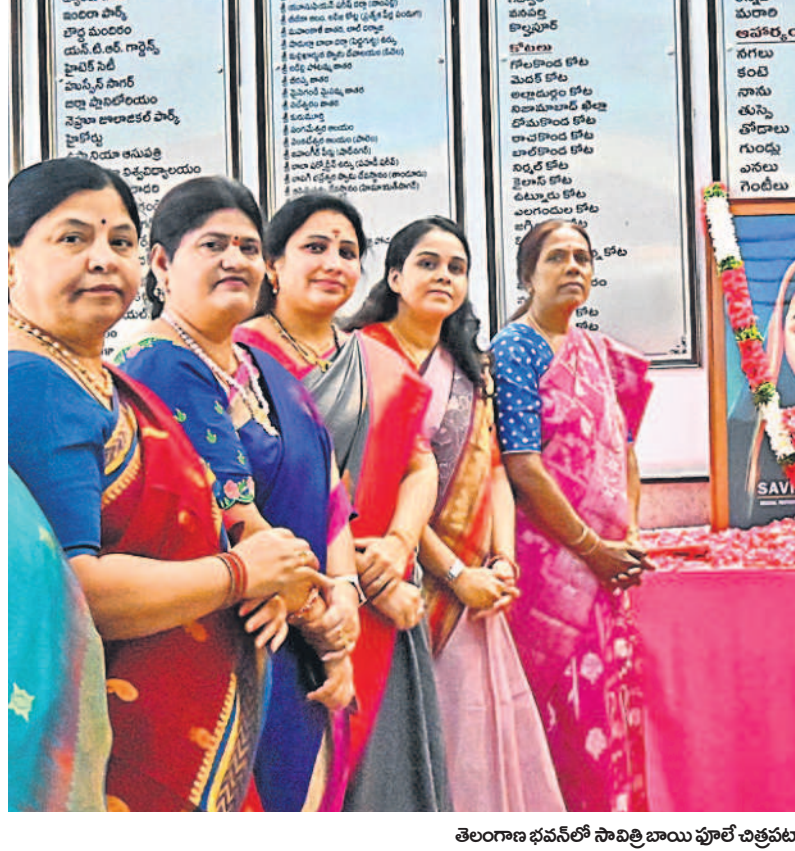
తెలంగాణ భవన్లో సామితి బాంబు పూల చిత్రవహినికి నివాళులర్పిస్తున్న జీఆర్ఎస్ మహిళా నేతలు

పుట్టావేలతో పాటు పలు ఆక్రమణలను తొలగించడమే లక్ష్యం తాత్కాలిక ఉద్యోగుల జీతాల ఖర్చు రూ.31.70 కోట్లుగా అంచనా సిటీబ్యూరో: హైద్రాలో అవుట్ సోల్స్ గా ఉద్యోగాల భర్తీకి అడుగులు వేసినట్లు. అతి త్వరలో 970 కాంట్రాక్ట్ ఉద్యోగాలను భర్తీ చేయనున్నట్లు హైద్రా అధికారులు తెలిపారు. కొత్తగా వచ్చే అధికారులకు ఎలాంటి బాధ్యతలు ఇవ్వాలో కూడా నిర్ణయించినట్లు తెలిసింది. ఈ ఏజెన్సీ ఒక సంవత్సరం పాటు అవుట్ సోల్స్ గా ప్రాజెక్టులకు 208 మంది మేనేజర్లు, 767 మంది అసిస్టెంట్లను నియమించనున్నారు. ఔటర్ రింగ్ రోడ్డులో పలు హైడ్రా పరిధిలో ఉన్న నీటి వనరులు, వాటర్లు, ప్రభుత్వ భవనాలు, నాలాలను రక్షించడంలో హైద్రాకు సహాయం చేయడం, అసభ్యక నిర్మాణాలు, ఆక్రమణలను గుర్తించడం వీరి బాధ్యతగా నిర్ణయించారు. హైదరాబాద్ లోని పుట్టావేలతో పాటు జలవనరులు, ప్రభుత్వ భవనాలలో వెలసిన ఆక్రమణలను తొలగించడంలో వీరిది తీలకపోతే అవి అధికారులు చెప్పారు. ఎంపీ జైన్ ఆభ్యులను ఏడు ప్యాకేజీలుగా విభజిస్తారు. మేనేజర్లకు రెండు, అసిస్టెంట్లకు ఐదు ప్యాకేజీలు ఉంటాయి. వీరి జీతాల కోసం మొత్తం ఖర్చు సంవత్సరానికి రూ.31.70 కోట్లు ఉంటుందని అధికారులు అంచనా వేశారు.