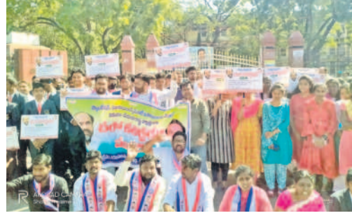
కరీంనగర్ కలెక్టరేట్ ఎదుట ధర్మా చేస్తున్న బీసీ యువజన సంఘం నాయకులు

కరీంనగర్ కలెక్టరేట్ ఎదుట ధర్మా చేస్తున్న బీసీ యువజన సంఘం ధర్మా