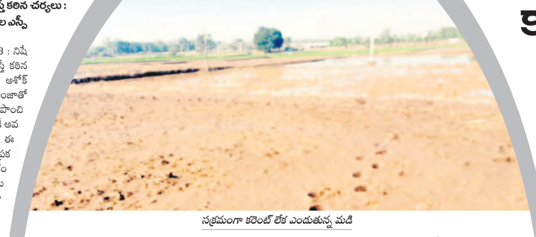
సక్రమంగా కరెంట్ లేక ఎండతున్న మండలి