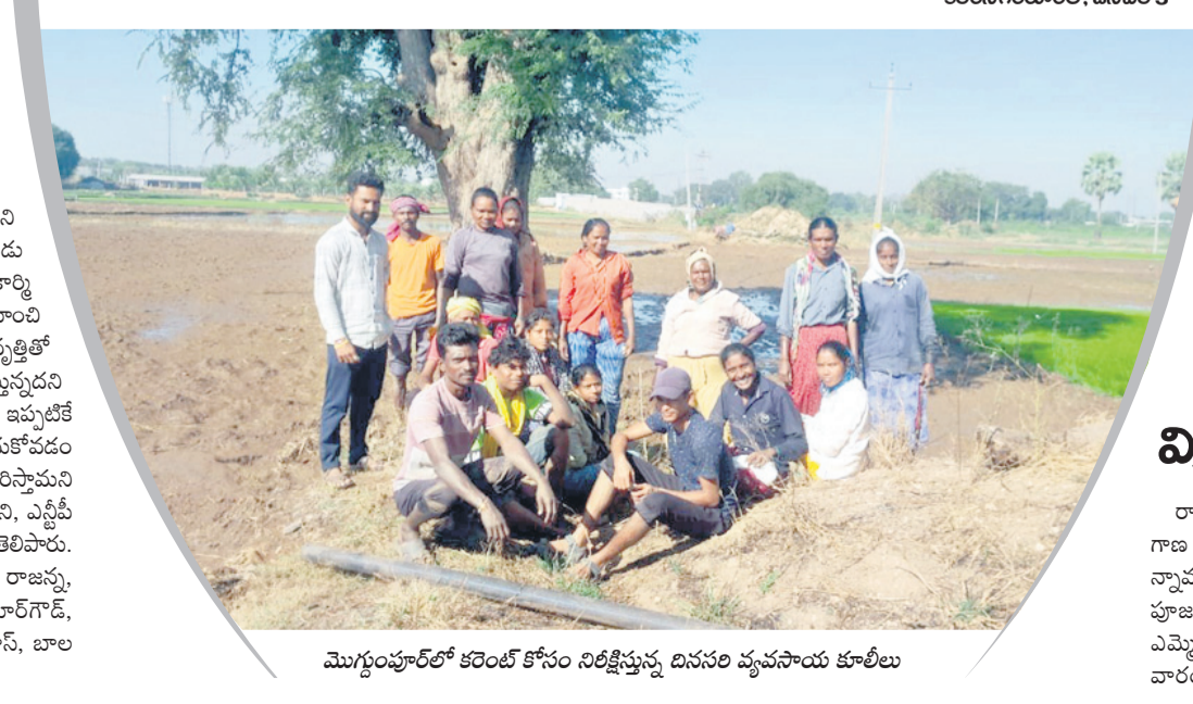
మొగ్గంపూర్లో కరెంట్ కోసం నిలిచిస్తున్న దినసరి వ్యవసాయ కూలీలు

కరెంట్లో పుణ్యమా.. అని రైతులు నాటిసేందుకు నానా అప్పులు పడుతున్నారు. ప్రస్తుతం యాసంగి నాట్ల ఉపమండలం కరెంటులో పాలం దున్నేందుకు నీటి అవసరం ఎక్కువగా ఉంటుంది. కరీంనగర్ మండలం మొగ్గంపూర్కు చెందిన పూర్తి అలయ్య తన బాలుగక రాలి పాలం వేసేందుకు 25 మంది బిహార్ కూలిలను ఒక్కొక్కరికి ₹500 చొప్పున మాట్లాడుకున్నాడు. నాటిసే ముందు పాలం దున్నడానికి నీళ్లు పెట్టాల్సి ఉండగా, శుక్రవారం తెల్లవారుజామున నుంచి మధ్యాహ్నం 12 గంటల వరకు కరెంటు లేకపోవడంతో ఇబ్బంది పడ్డారు. పొలంలో నీళ్లు లేకపోవడంతో దున్నడం ఆగిపోగా, నాలు వేయాలిని కూలిలు ఇలా ఖాళీగా ఉండాలి వచ్చింది. 12 గంటల తర్వాత కరెంటు వచ్చినా నీళ్లు పెట్టి, దున్నేసరికి సాయంత్రం కావడంతో నాలు వేయడం వీలు కాలేదు. ఫలితంగా రైతు తీవ్రంగా నష్టపోవాల్సి వచ్చింది. ఇలా గ్రామాల్లో చాలా మంది రైతులు నిత్యం అవస్థలు పడుతున్నారు.