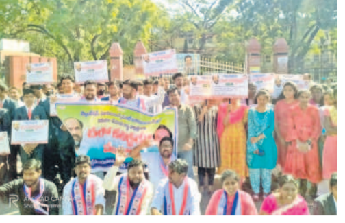
కరీంనగర్ కలెక్టరేట్ ఎదుట ధర్నా చేస్తున్న బీసీ యువజన సంఘం నాయకులు

కరీంనగర్ కలెక్టరేట్ ఎదుట బీసీ యువజన సంఘం ధర్నా