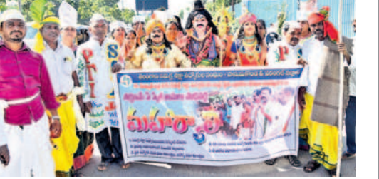
వివిధ వేషధారణల్లో సమగ్ర శిక్షా ఉద్యోగులు

హనుమకొండ/జనగామ పోర్టు/ములుగు రూరల్ : తమ ఉద్యోగాలు క్రమబద్ధీకరించాలన్న డిమాండ్‌తో సమగ్ర శిక్షా ఉద్యోగులు చేస్తున్న నిరసనకు సమ్మె కొనసాగుతున్నది. గురువారం వరంగల్ కమ్యూన్ జిల్లాలో ఉద్యోగులు వివాహ క్రీడిలో నిరసన తెలిపారు. హనుమకొండలో శివుడు, పాతరాజు, రుద్రమణి, గణపతి, భరతమాత, సమృద్ధి, సారలమ్మ తదితర వేషధారణతో ఉద్యోగులు కిక్కి స్టూపం నుంచి అంబేద్కర్ నింటర్ వరకు మహారాష్ట్రీ నిర్వహించారు. ఈ సందర్భంగా అదాలత్ జంక్షన్‌లోని అవతరవీరుల స్టూపం, నక్కలగుట్టలోని ప్రజాకవి కోశ్ జీ విగ్రహానికి పూలమాల వేసి నివాళులర్పించారు. అలాగే అంబేద్కర్ విగ్రహానికి పూలమాల వేసి