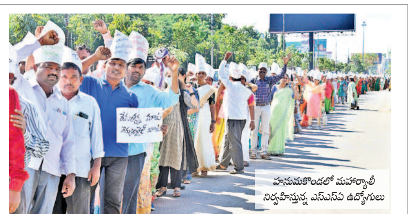
హనుమకొండలో మహారాష్ట్రీ నిర్వహిస్తున్న ఎస్ఎస్ఎస్ ఉద్యోగులు