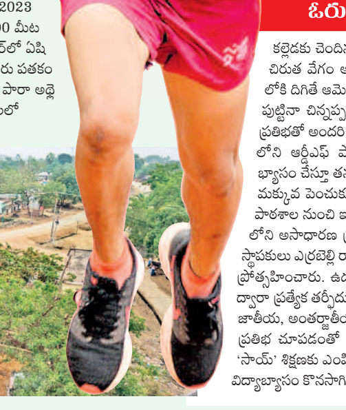
ఓరుగల్లు ముద్దుబిడ్డను ఏరించిన విశిష్ట పురస్కారం