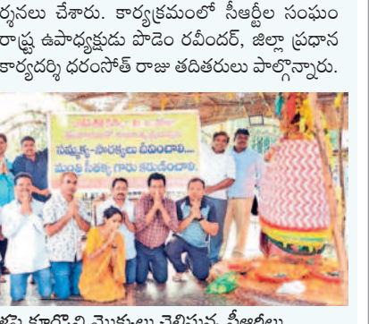
మోక్షాపై కూర్చోని మొక్కలు చెల్లిస్తున్న సీతక్కలు

■ మేడారంలో సీతక్క మొక్కలు ఏటూరునాగారం : సమ్మె తల్లి దీవించాలని, మంత్ర సీతక్క కరుణించాలని కోరుతున్న సీతక్క మేడారంలోని గడ్డిపై మోక్షా మీద కూర్చోని మొక్కలను పడకొండ కోశాధికారి సీతక్కలు ఐటీడీపీ వద్ద నిరసనకు సమ్మె చేస్తున్న విషయం తెలిసినది. ప్రభుత్వం స్పందించకపోవడంతో గురువారం మేడారం వెళ్లి తమ ఉద్యోగులు రెగ్యులర్ కావాలని సమ్మెకర్ల సారలమ్మ తల్లిలను వేడుకున్నారు. ఈ సందర్భంగా వివాహ క్రీడిలో ప్రద