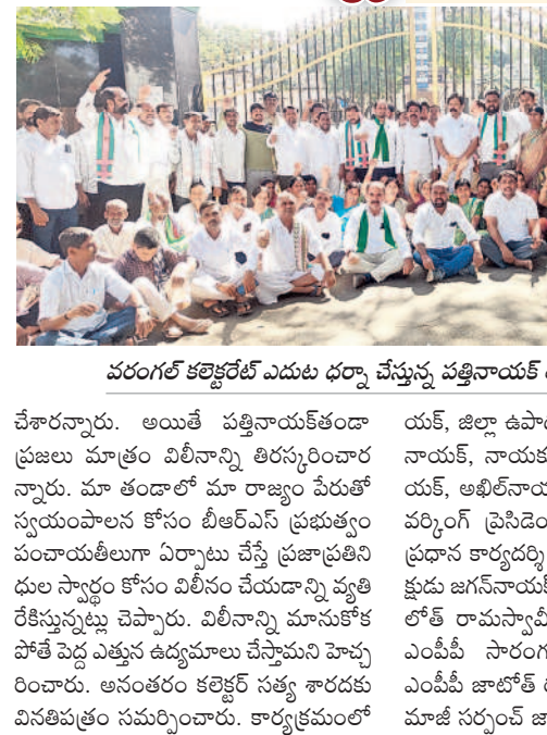
వరంగల్ కల్లెడలో ఎదురు ధర్మా చేస్తున్న పత్రికాయతీ తండావారులు