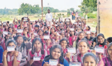
విద్యార్థులతో సభ్యత్వాలు చేయిస్తున్న నాయకులు

మతపరమైన వివాదాలను తీవ్రం చేయకుండా కొబ్బరికాయల విక్రయానికి వేలం. మతపరమైన వివాదాలను తీవ్రం చేయకుండా కొబ్బరికాయల విక్రయానికి వేలం.