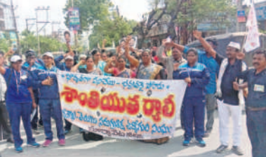
సూర్యాపేటలో ర్యాలీ నిర్వహిస్తున్న సమగ్ర శిక్షా ఉద్యోగులు

సూర్యాపేట టౌన్, జనవరి 2: తెలంగాణ సమగ్ర శిక్షా ఉద్యోగుల సంఘం అధ్యక్షులు సుమారు 700 మంది జిల్లా కేంద్రంలోని ప్రధాన వీధుల గుండా గురువారం శాంతియుత ర్యాలీ నిర్వహించారు. ఈ సందర్భంగా పలువురు మాట్లాడుతూ.. నాన్ని అందజేయాలని పేర్కొన్నారు. ఈ కార్యక్రమంలో సంఘం అధ్యక్షుడు గులకు ఇప్పిన హామీలను అమలు చేయాలన్నారు. సమగ్ర శిక్షా ఉద్యోగులను విద్యాశాఖలో విలీనం చేయడంతో పాటు రెగ్యులర్ చేయాలని ప్రభుత్వాన్ని కోరారు. గత 20 రోజులుగా తమ సమస్యలను పరిష్కరించాలని ఆందోళనలు చేస్తున్నా ప్రభుత్వం పట్టించుకోకపోవడం సరికాదన్నారు. పనికి తగిన వేతనాలు అందించాలని ప్రజలు కోరుతున్నారు.