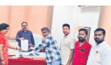
డిఎంపావోడకు వినతిపత్రం అందజేస్తున్న నాయకులు

సూర్యాపేట టౌన్, జనవరి 2: ప్రభుత్వ ఆస్తులను బలోపేతం చేయాలని ప్రజలు కోరుతున్నారు. ప్రభుత్వ ఆస్తులను బలోపేతం చేయాలని ప్రజలు కోరుతున్నారు.