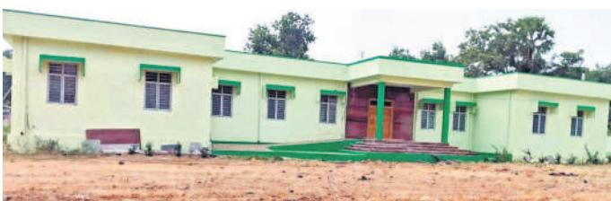
నూతనంగా నిర్మించిన భవనం

నిధులు విడుదల చేయకపోవడంతో.. ప్రస్తుత ప్రభుత్వం నిధులు విడుదల చేయకపోవడంతో కనీసం 20 రోజులుగా పని ఆగిపోయింది. ప్రస్తుత ప్రభుత్వం నిధులు విడుదల చేయకపోవడంతో కనీసం 20 రోజులుగా పని ఆగిపోయింది.