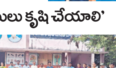
అభ్యున్నతి కోసం ఉపాధ్యాయులు కృషి చేయాలి

విద్యార్థుల అభ్యున్నతికి ఉపాధ్యాయులు కృషి చేయాలి. విద్యార్థుల అభ్యున్నతికి ఉపాధ్యాయులు కృషి చేయాలి.