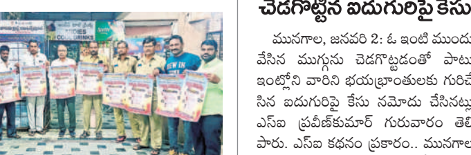
పోర్ట్ ఆవిష్కరిస్తున్న అర్జీని యూనియన్ నాయకులు

సూర్యాపేట అర్బన్, జనవరి 2: అర్జీని రాష్ట్ర సదస్సును జయప్రదం చేయాలి. సూర్యాపేట అర్బన్, జనవరి 2: అర్జీని రాష్ట్ర సదస్సును జయప్రదం చేయాలి.