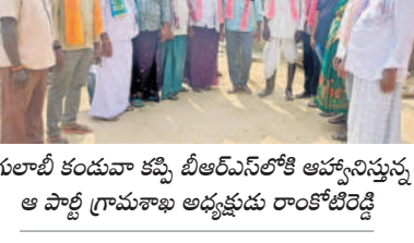
గులాబీ కందుకూరి కమిటీ బీఆర్ఎస్ లో చేరికలు

చింతలపాలెం, జనవరి 2: మండల కేంద్రంలోని బీఆర్ఎస్ లో చేరికలు. చింతలపాలెం, జనవరి 2: మండల కేంద్రంలోని బీఆర్ఎస్ లో చేరికలు.