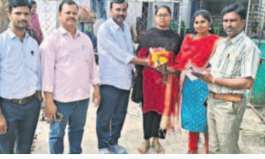
విద్యార్థులకు పుష్పగుచ్ఛం అందజేస్తున్న అధ్యాపకులు

నేరేచిపల్లి, జనవరి 2: ఇంటర్ బోర్డు ఉన్నతాధికారుల ఆదేశాల మేరకు ప్రభుత్వ జూనియర్ కళాశాలలో విద్యార్థుల హాజరు శాతం మించడానికి స్టానిక ప్రభుత్వ జూనియర్ కళాశాల అధ్యాపకులు విమాత్యంగా ప్రయత్నించారు. గురువారం గడపల్లి, పోనుగోడు, అల్లి రెడ్డిగూడెం తదితర గ్రామాల నుంచి కళాశాలకు గ్రూపులలో విద్యార్థులు ఇండ్లకు వెళ్లి పుష్పగుచ్ఛాలు అందజేసి కళాశాలకు క్రమం తప్పకుండా రావాలని కోరారు. ఈ కార్యక్రమంలో అధ్యాపకులు