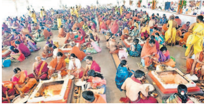
యజ్ఞంలో పాల్గొన్న వివిధ ప్రాంతాలకు చెందిన దంపతులు