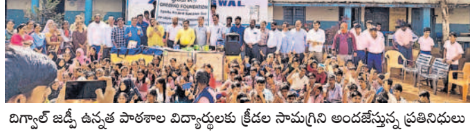
బిగ్నాల్ జడ్పీ ఉన్నత పాఠశాల విద్యార్థులకు క్రీడల సామగ్రిని అందజేస్తున్న ప్రతినిధులు