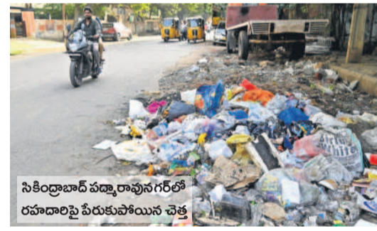
సికింద్రాబాద్ వద్ద రావులగల్లో రహదారిపై పేరుకాచియిన చెత్త

అమడ దూరంలో కాన్సిల్.. మూడు నెలలకోసారి జరగాల్సిన సర్వసభ్య సమావేశం ఐదు నెలలు గడిచినా పట్టణ యంత్రాంగం 'స్టాండింగ్' సమావేశాల బాటలోనే పాలక మండలి చట్టాల అమల్లో అలసత్వం.. కమిషనర్ వైఖరిపై అసంతృప్తి సిటీబ్యూరో: జిహెచ్ఎంసీలో పాలన గాడి తప్పుతోంది. ఐజానాలో చిల్లిగవ్వ లేక అభివృద్ధి పనులు కుంటున్న పరిస్థితులు నెలకొన్నాయి. పురోగతిలో ఉన్న పనులు సకాలంలో పూర్తి చేయకుండా నెలల తరబడి కాలయాపన చేస్తున్నారు. అన్నింటికంటే ముఖ్యంగా ప్రస్తుత చట్టాల ఉల్లంఘన జరుగుతున్నది. వాస్తవంగా ప్రతి వారానికొకసారి స్టాండింగ్ కమిటీ సమావేశం జరగాలి. మేయర్ అధ్యక్షతన జరిగే ఈ సమావేశంలో 15 మంది స్టాండింగ్ కమిటీ సభ్యులు వలు అభివృద్ధి పనుల ప్రతిపాదనలపై చర్చించి రూ. 2 కోట్ల నుంచి రూ. 3 కోట్ల మేర విలువైన పనులకు ఆమోదం దక్కతుంది. గడిచిన కొన్ని నెలలుగా స్టాండింగ్ కమిటీ ముందుకు ఎజెండా అంశాలు రాకుండా సమావేశాలు వాయిదా వేస్తూ వస్తున్నాయి. దీంతో ప్రజా సమస్యలు మరింత జటిలమవుతున్నాయి. అభివృద్ధి పనులపై నిర్లక్ష్యం చేయడం వల్ల ప్రజలు సైతం ఆగ్రహం వ్యక్తం చేస్తున్నారు. తాజాగా ఈ కోవలోకి ప్రతి మూడు నెలలకోసారి జరగాల్సిన సర్వ