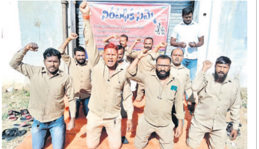
డిస్ పల్లిలో మోక్షాన్ని నిలబడి నిరసన తెలుపుతున్న హమాలీలు

ప్రభుత్వంతో కుదిరిన ఒప్పందం మేరకు వేతనాలు చెల్లించాలని, కూలి రేట్లు పెంచి ఇవ్వాలని డిమాండ్ చేశారు. పెంచిన రేట్ల ప్రకారం క్వింటాలుకు 29 రూపాయలు చెల్లించాలన్నారు. కార్మికులు, స్వచ్ఛలకు ఆరోగ్యవాడ రూ. 10 లక్షలు ఇవ్వాలని కోరారు. బోధన్ లో ఏబిఎస్ డి అధ్యక్షులతో కార్మికులు గోదామునకు తాళం వేసి నిరసన చేపట్టారు.