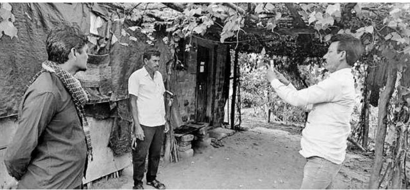
కాటాల్లో ఇందిరమ్మ ఇళ్ల సర్వే చేస్తున్న సిబ్బంది

జనశంకర్ భూపాలపల్లి. జనవరి 2 (నమస్తే తెలంగాణ) : ఇందిరమ్మ ఇళ్ల సర్వే నక్షత్రసంకరణ కొనసాగుతుంది. యాప్ తో తలెత్తుకున్న సాంకేతిక సమస్యలతో సిబ్బంది సచమతమవుతున్నారు. యాప్ ఓపెన్ కాకపోవడం, ఓపెన్ అయినా సమాధి జాప్యం కావడంతో ఒక్కో ఇంటి సర్వే అదగంతుకు పైగా పడుతుందని కొనసాగుతున్నది. కాగా, ప్రభుత్వం డిసెంబర్ 31లో సర్వే పూర్తి చేయాలని ఆదేశించినా ఇప్పటి వరకు సగం సైతం పూర్తి కాలేదు. ప్రభుత్వం ఇచ్చిన గడువు పూర్తయినా జిల్లాలో కేవలం 53.51 శాతం సర్వే మాత్రమే జరిగింది. యాప్ తో తమ ప్రజాపాలన దరఖాస్తు వివరాలు కనిపించడం లేదని ప్రజలు ఆందోళన వ్యక్తం చేస్తున్నారు. వివరాలు ఆన్ లైన్ లో సరిగా నమోదు చేయకపోవడం వల్ల తమ డేటా కలిపించడం లేదని వాపోతున్నారు. ఇందిరమ్మ ఇళ్ల సర్వే అయినా పొందలేక ఇంట్లో ఉన్నారని తలచుకుంటున్నారు. గ్రామాలు, పట్టణాలలో కాన్సర్వేషన్ యాలకు చెందిన ఉద్యోగులు, సిబ్బందిని వినియోగించి చూస్తున్నాడీ యాప్ తో సాంకేతిక సమస్యలు అడ్డంకిగా మారాయి. యాప్ లో సర్వే చేసిన వారి వివరాలు మళ్లీ చేయవల్సి చూపిస్తున్నారని, ఒక్కో దరఖాస్తుకు అదగినట్లు పైగా సమయం పడుతుందని ఉద్యోగులు చెబుతున్నారు. జిల్లాలోని 11 మండలాలకు భూపాలనపై మున్సిపాలిటీలో గత నెల 10న ప్రారంభమైన సర్వే డిసెంబర్ 31లో ముగియగా ఇప్పటి వరకు 53.51 శాతం మాత్రమే నమోదైంది.