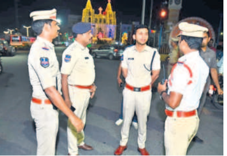
మంగళవారం అర్ధరాత్రి నల్లగొండ డ్రాఫ్ట్ పోలీస్ సిబ్బందికి నూతన సంవత్సరం సందర్భంగా ఫోటో