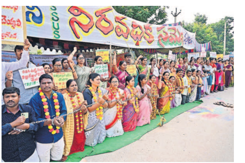
నల్లగొండ కలెక్టరేట్ వద్ద సంకెళ్ల వేసుకుని నిరసన వ్యక్తం చేస్తున్న సమగ్ర శిక్ష ఉద్యోగులు