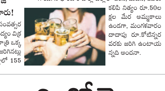
నల్లగొండ సీట్, జనవరి 1 : నూతన సంవత్సరం వేడుకల సందర్భంగా నల్లగొండ జిల్లాలో మద్యం విక్రయాలు జోరుగా సాగాయి. డిసెంబర్ 31 రాత్రి ఒక్కరోజే రూ.12 కోట్ల మద్యం అమ్మకాలు జరిగినట్లు ఎక్సైజ్ శాఖ లెక్కలు చెబుతున్నాయి. జిల్లాలో 155

వైస్కోతోపాటు బార్లు ఉండగా.. వైస్కో అర్ధరాత్రి 12 గంటలు, బార్లు ఒంటి గంట వరకు తెరిచి ఉంచారు. మరోవైపు మాంసం విక్రయాలు కూడా వెల్లువెత్తిన జరిగాయి. సాధారణ రోజుల్లో జిల్లాలో వివెన్, మటన్, చేపలు కలిపి నిత్యం రూ.50ల క్షల మేర అమ్మకాలు ఉండగా, మంగళవారం దాదాపు రూ.కోటివరకు వరకు జరిగి ఉంటాయన్నది అంచనా.