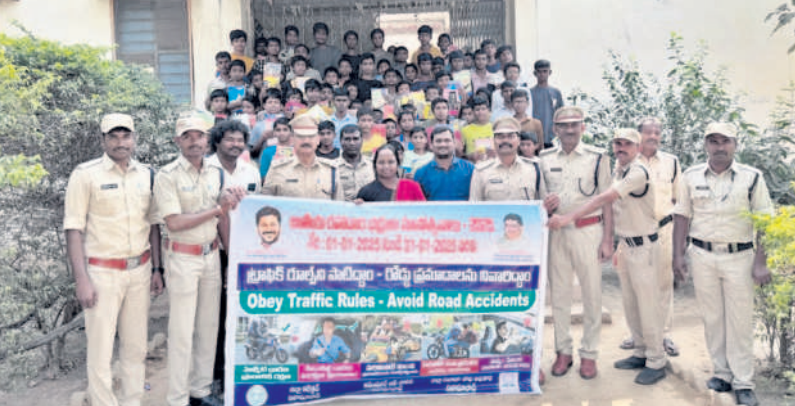
మోపాల్లోని బీసీ సంక్షేమ పాఠశాల వద్ద అవగాహన కల్పిస్తున్న అధికారులు