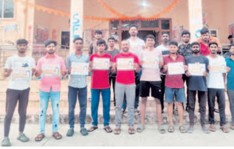
డివిజన్లో పోషోత్తంను ఆవిష్కరిస్తున్న బీసీ మహాజన నాయకులు