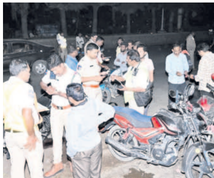
జిల్లా కేంద్రంలో డ్రంక్ అండ్ డ్రైవ్ తనిఖీలు చేపడుతున్న పోలీసులు