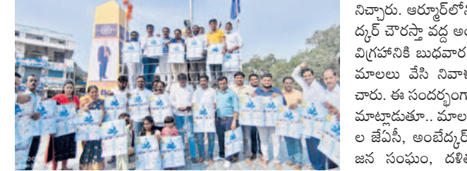
క్యాబినెట్ను ఆవిష్కరిస్తున్న మాల సంఘాల నాయకులు