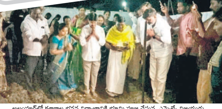
అలంపూర్లో కళాశాల భవన నిర్మాణానికి భూమి పూజ చేస్తున్న ఎమ్మెల్యే విజయమ