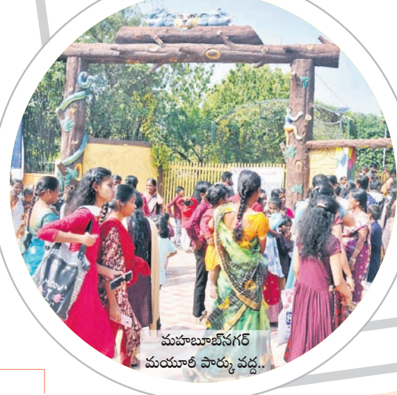
మహబూబ్ నగర్ మయారీ పార్కు వద్ద..

కొత్త సంవత్సరంలోకి అడుగిడిన వేళ నూతనోత్సాహం ఉట్టిపడింది. ఉమ్మడి జిల్లా వ్యాప్తంగా న్యూఇయర్ వేడుకలు అంబరాన్నంటాయి. డిసెంబర్ 31న ఏమి, వినోదాలతో ఆనందంగా సందడి చేశారు. పటాకులు కాల్పుతూ సంబురాలు కేలంతలు కొడుతూ కొత్త ఏడాదికి ఘన స్వాగతం పలికారు. కేక్ కటింగ్లు, న్యూ ఇయర్ విషెస్ తో కేక్ కటింగ్లు, న్యూ ఇయర్ విషెస్ తో ప్రణాళికలు రూపొందించుకొని.. సంతోషంగా గడిపారు. మహిళలు ఇంట్ల ముందు రంగుబల్లలు వేశారు. బిన్నాపెద్ద అంతా ఆలయాలను దర్శించుకున్నారు. క్రైస్తవులు చర్చులకు వెళ్లి ప్రార్థనలు చేశారు. పార్కులు.. పర్యాటక ప్రాంతాలకు తాకిడి పెరిగింది. వేడుక ప్రజల్లో జోష్ నింపింది. - నెట్ వర్క్ మహబూబ్ నగర్, జనవరి 1