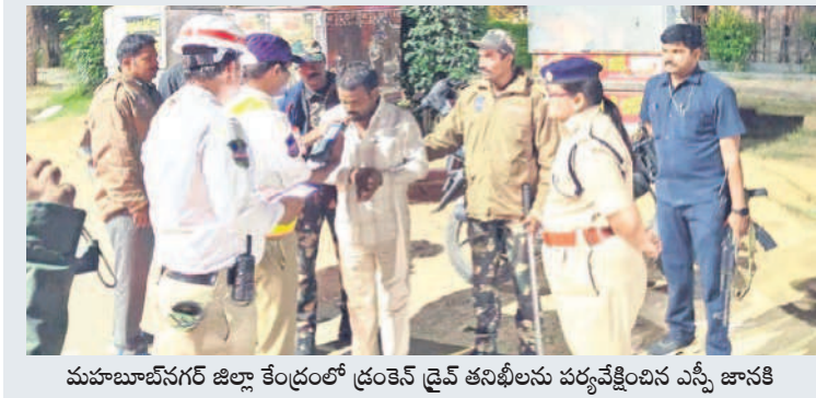
మహబూబ్ నగర్ జిల్లా కేంద్రంలో డ్రంకెన్ డ్రైవ్ తనిఖీలను పర్యవేక్షించిన ఎస్పీ జానకి