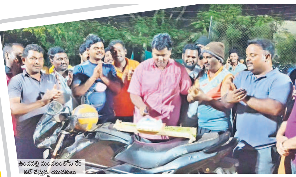
ఉండవల్లి మండలంలోని కేక్ కట్ చేస్తున్న యువకులు