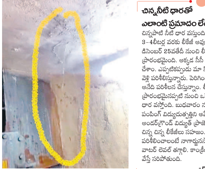
డ్రాఫ్ట్ ట్యూబ్ జోన్ ఫోర్ స్టాప్ వద్ద లీకేజీ దృశ్యం

• శ్రీశైలం ఎడమగట్టు జల విద్యుత్ కేంద్రంలో ఘటన • యూనిట్-1 వద్ద నిమిషానికి 4 లీటర్ల చొప్పున ధార • ఎలాంటి ప్రమాదం లేదన్న ప్రాజెక్టు సీకా రామసుబ్బారెడ్డి అశ్రువేలు, జనవరి 1 : శ్రీశైలం ఎడమగట్టు జల విద్యుత్ కేంద్రం వద్ద వారం రోజులుగా నీటి లీకేజీ జరుగడం ప్రధానంగా 1వ యూనిట్ జోన్ ఫోర్ డ్రాఫ్ట్ ట్యూబ్ నుంచి నీటి ధార కొనసాగుతున్నది. డ్రాఫ్ట్ ట్యూబ్ నుంచి లీకేజీ జరుగుతున్న విషయాన్ని డిసెంబర్ 25వ తేదీన సిద్ధాధికారులు గుర్తించి జెసికో అధికారుల దృష్టికి తీసుకొచ్చారు. దీంతో జెసికో అధికారులు లీకేజీని పరిశీలించి ఉన్న తాడూరులకు సమాచారం అందించారు. హైదరాబాద్ నుంచి విద్యుత్ తోడనవించి జనరల్ సర్వీసెస్ సీవీఆర్ సీకా హైదర్ నారాయణ వద్ద పరిశీలించారు. లీకేజీ సంబంధించి నివేదిక ఇవ్వాలని స్థానిక ఇంజనీర్లను ఆదేశించారు. నీటి లీకేజీని ఎప్పుడోపుడు పరిశీలించే మే దకు అక్కడ సీసీ కెమెరా ఏర్పాటు చేశారు. గంటలంతట వెళ్లి ప్లమ్బర్స్ నిర్వహించి పరిశోధించారు. అయితే రివర్స్ వీటి డ్రాఫ్ట్ ట్యూబ్ చేయడం వల్ల వైబ్రేషన్లకు గురై నీటి ఒత్తిడి పెరిగి లోపల ఉన్న పైపు వెల్లింగ్ నుంచి లీకేజీ అవుతున్నట్లు జెసికో అధికారులు భావిస్తున్నారు. పంపు మోడల్లో టర్బైన్ వేగంగా తిరుగుతుండడంతో డ్రాఫ్ట్ ట్యూబ్ జోన్ ఫోర్ స్టాప్ నుంచి నీటి ధారగా లీకేజీ జరుగుతుంది. స్టాప్ వాంబర్, ప్లమ్బర్స్ గ్రేడ్లను మూసివేసి, టర్బైన్లో నిల్వ ఉండే నీటిని పూర్తిగా తొలగించి లోపలికి వెళ్లి పరిశీలించాలి.