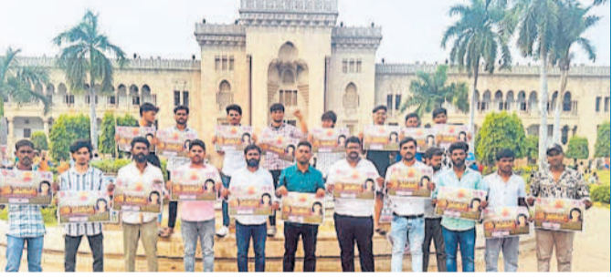
జీసీ మహాసభ వారేపాళ్లర్ ఆవిష్కరిస్తున్న జీఆర్ఎస్ఎస్ నాయకులు