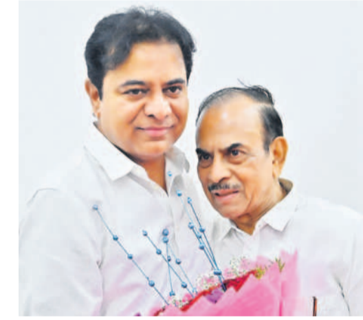
మాజీ డిప్యూటీ సీఎం మహమ్మద్ బిల్