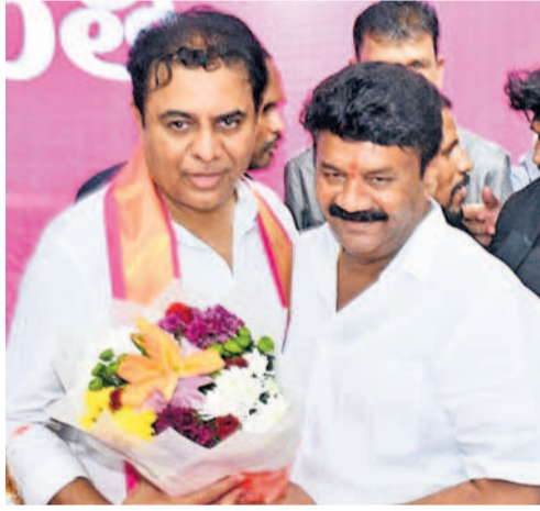
ఎమ్మెల్యే తలసాని శ్రీనివాస్ యాదవ్