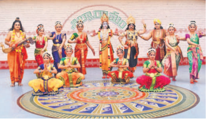
స్వచ్ఛ ప్రదర్శన రిస్పన్స్ కళాకారులు