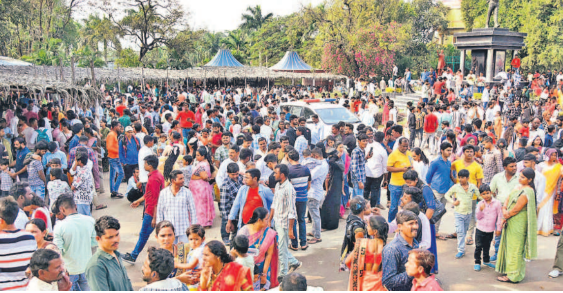
కొత్త ఏడాది తొలి రోజు జనవరి 1, బుధవారం నాడు కిక్కిరిసిపోయిన జూపార్కు