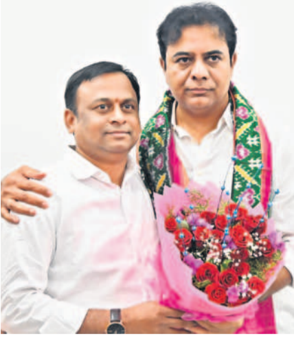
జీఆర్ఎన్ నేత గిల్ల శ్రీనివాస్ యాదవ్