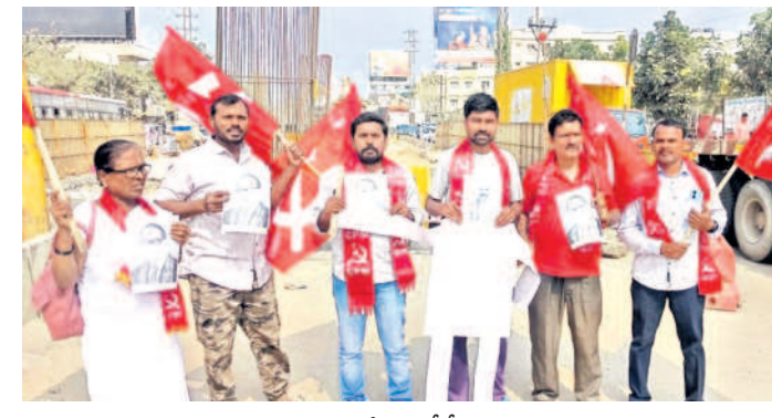
నిరసన వ్యక్తం చేస్తున్న సీపీఎం నాయకులు