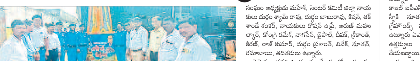
తెలంగాణ: మండల కేంద్రంలో శౌర్య దివస్ నిర్వహిస్తున్న దళిత నాయకులు

తెలంగాణ, జనవరి 1: మండల కేంద్రంలోని అంబేద్కర్ విగ్రహం వద్ద శౌర్య దివస్ను బుద్ధవారం ఘనంగా జరుపుకొన్నారు. ఈ సందర్భంగా దళిత నాయకులు పూలూలు వేసి శ్రద్ధాంజలి ఘటించారు. 1818లో జరిగిన సంఘటనను స్మరించుకున్నారు.