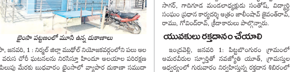
బైసెంటో పట్టణంలో మూసీ ఉన్న దుకాణాలు