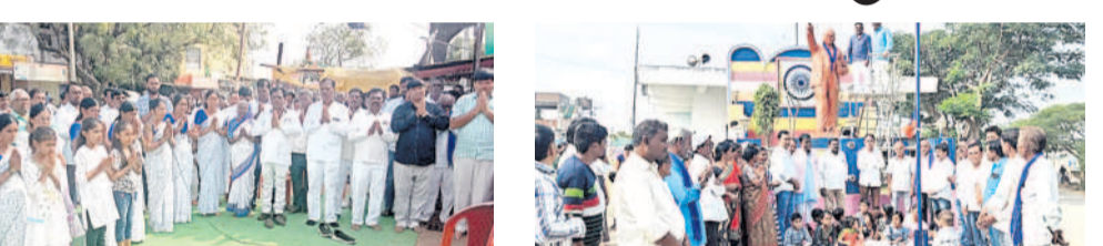
ఇంద్రవెల్లి: సామూహికంగా వందల తీసుకుంటున్న బౌద్ధ ఉపాసకులు, నాయకులు