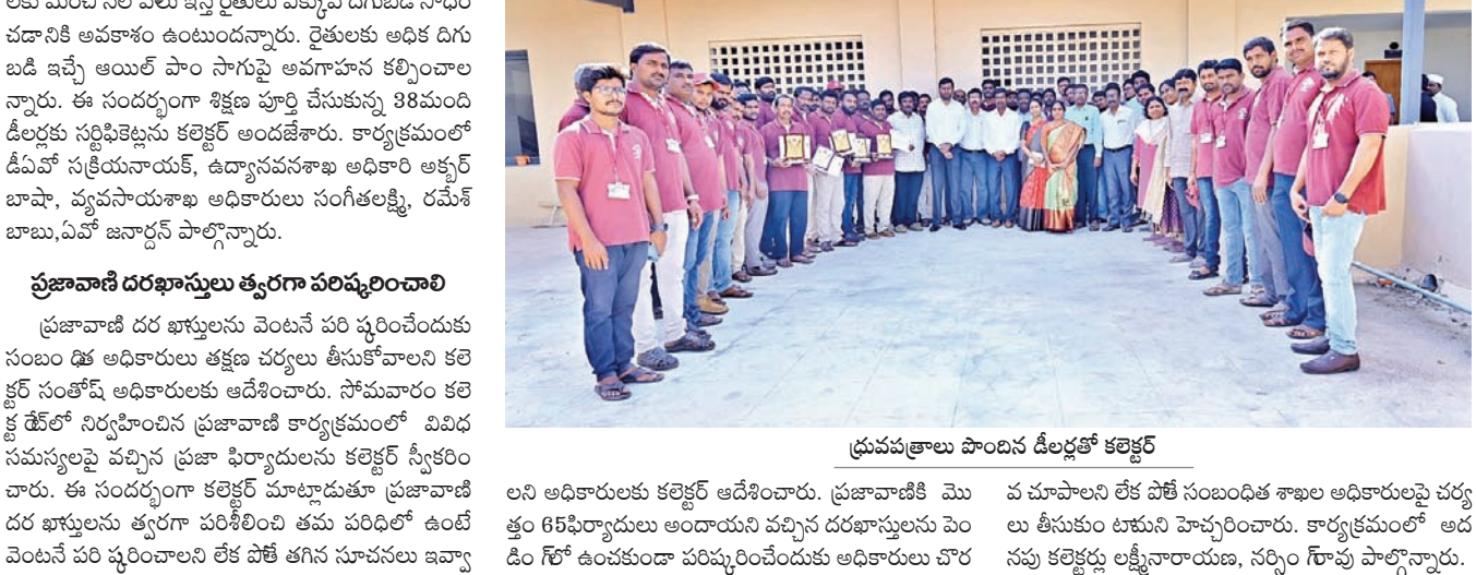
ప్రజావాణి దరఖాస్తులు త్వరగా పరిష్కరించాలి

గద్దాల, డిసెంబర్ 30 : డిప్యూటీ కలెక్టర్ నేతృత్వంలోని పరిజ్ఞానం రైతులకు ఉపయోగపడే విధంగా కృషి చేయాలని కలెక్టర్ సంతోష డీలర్లకు సూచించారు. సోమవారం కలెక్టర్ రేట్లో వ్యవసాయశాఖ ఆధ్వర్యంలో ఏర్పాటు చేసిన డిప్యూటీ కలెక్టర్ సంతోష డీలర్లకు సూచించారు. సోమవారం కలెక్టర్ రేట్లో వ్యవసాయశాఖ ఆధ్వర్యంలో ఏర్పాటు చేసిన డిప్యూటీ కలెక్టర్ సంతోష డీలర్లకు సూచించారు. సోమవారం కలెక్టర్ రేట్లో వ్యవసాయశాఖ ఆధ్వర్యంలో ఏర్పాటు చేసిన డిప్యూటీ కలెక్టర్ సంతోష డీలర్లకు సూచించారు. సోమవారం కలెక్టర్ రేట్లో వ్యవసాయశాఖ ఆధ్వర్యంలో ఏర్పాటు చేసిన డిప్యూటీ కలెక్టర్ సంతోష డీలర్లకు సూచించారు.