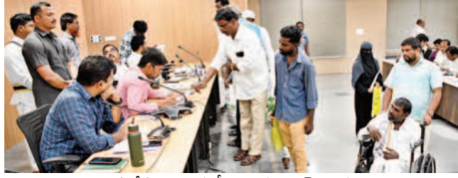
ప్రజావాణి ఫిర్యాదులను స్వీకరిస్తున్న కలెక్టర్, అదనపు కలెక్టర్లు