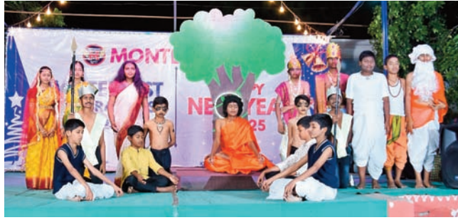
నాటిక ప్రదర్శిస్తున్న విద్యార్థులు