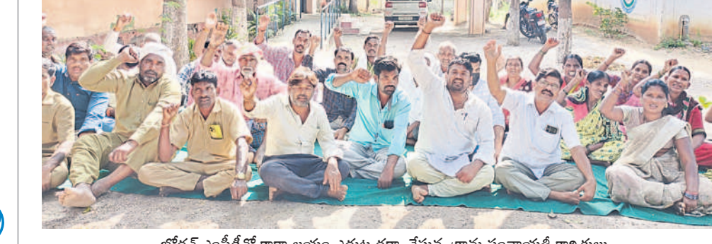
బోధన్ ఎంచీవీవీ కార్యాలయం ఎదుట ధర్నా చేస్తున్న గ్రామ పంచాయతీ కార్యకులు

కాంగ్రెస్ పార్టీ ఇచ్చిన హామీలను నిలబెట్టుకోవాలని, ఉద్యోగ భద్రత కల్పించాలని డిమాండ్ చేస్తూ నిజామాబాద్ జిల్లాలో గ్రామ పంచాయతీ కార్యకులు, సిబ్బంది శనివారం ధర్నా నిర్వహించారు. బోధన్, డివైపల్, రుద్రూర్, కోటగిరి, ఎడవల్లి తదితర మండలాల ఎంచీవీవీ కార్యాలయాల ఎదుట బైరాన్లు వేసారు. మల్లీవరస వరల్డ్ విద్యానాన్ని రద్దు చేసి ఉద్యోగ భద్రత కల్పించాలని డిమాండ్ చేశారు. ఐదు నెలల నుంచి జిల్లాలు లేక ఇబ్బందులు పడుతున్నామని, వెంటనే పెండింగ్ వేతనాలను చెల్లించాలని డిమాండ్ చేశారు. - బోధన్ రూరల్, డిసెంబర్ 28