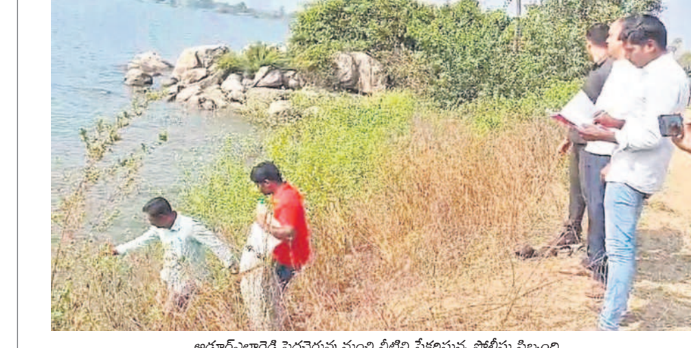
అడ్డూర్ ఎల్లారెడ్డి చెరువు నుంచి నీటిని సేకరిస్తున్న పోలీసు సిబ్బంది