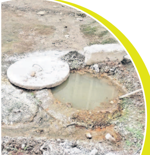
ఆసుపత్రిలో మరుగుదొడ్ల నుంచి బయటకొస్తున్న మురుగునీరు