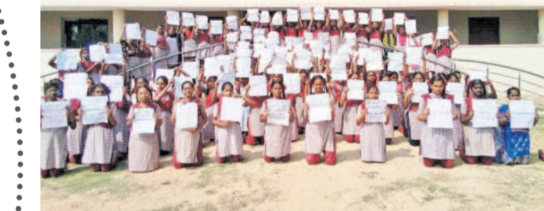
బింతకాని కేజీబీవీ ఎదుట మోక్షపై కూర్చోని వినూత్న నిరసన

మధిర(బింతకాని), డిసెంబర్ 28 : వార్షిక పరీక్షలు దగ్గరపడుతున్నందున మా టీచర్ల సమస్యలు పరిష్కరించండి.. చదువులు చెప్పాలా చూడండి సీఎం సారూ.. అంటూ ఖమ్మం జిల్లా బింతకాని కేజీబీవీ ఎదుట విద్యార్థినులు ప్రకారం లతో మోక్షపై కూర్చోని శనివారం వినూత్న నిరసన తెలిపారు. టీచర్ల సమస్యలను పరిష్కరించాలని నిరూపించారు. ఈ సందర్భంగా పలు పురు విద్యార్థినులు మాట్లాడుతూ తమకు