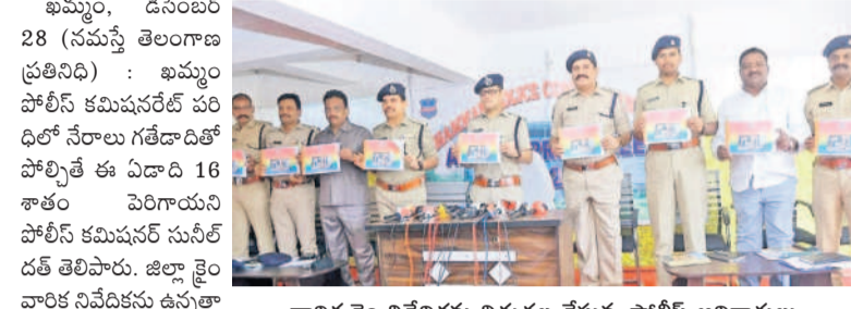
వార్షిక క్రైం నివేదికను విడుదల చేస్తున్న పోలీస్ అధికారులు

ఖమ్మం, డిసెంబర్ 28 (నమస్తే తెలంగాణ ప్రతినిధి) : ఖమ్మం పోలీస్ కమిషనరేట్ పరిధిలో చేరాలా గతేడాదితో పోలిస్తే ఈ ఏడాది 16 శాతం పెరిగాయని పోలీస్ కమిషనర్ సునీల్ దత్ తెలిపారు. జిల్లా క్రైం వార్షిక నివేదికను ఉన్నతాధికారులతో కలిసి శనివారం ఖమ్మంలో జరిగిన మీడియా సమావేశంలో పింగ్ కేసులు పెరిగాయని తెలిపారు. రోడ్డు ప్రమాదాలు 785 జరిగాయని వాటిలో 281 మరణాలు సంభవించాయని తెలిపారు. 700 డౌంగ్ కనాలు కేసులు నమోదు చేశామని వాటి ద్వారా ప్రజలు రూ.5,58,17,584 నష్టపోయారని వాటిలో ఇప్పటివరకు రూ.1,55,98,278 రికవరీ చేశామని తెలిపారు. కేసుల నమోదు, దర్యాప్తు, శిక్షలు పడే విషయంలో పోలీసు అధికారులు సమర్థవంతంగా పనిచేస్తున్నారని తెలిపారు. ఈ సమావేశంలో అడిష్ట్ర సీనియర్, ఈ కేసుల్లో రూ.34,92,88,973 ప్రజలు నష్టపోయారని వాటిలో రూ.24,292,363 అకౌంట్లో డబ్బులను హోల్డ్ చేశామని, రూ.52,13,310 రికవరీ చేశామని వివరించారు.