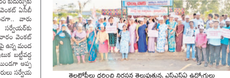
తెల్లటోపీలు ధరించి నిరసన తెలుపుతున్న ఎన్ఎస్ఐ ఉద్యోగులు