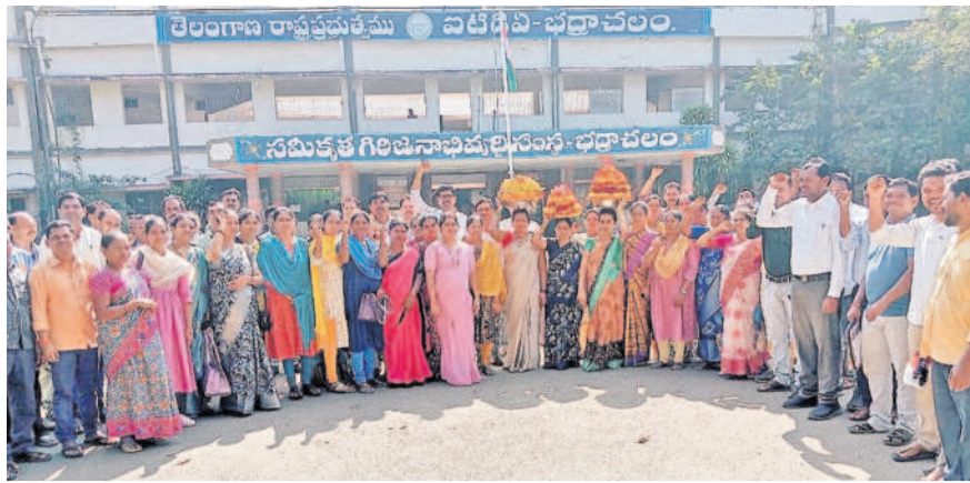
భద్రాచలం ఐటీడిఎ ఎదుట బతుకమ్మలతో నిరసన తెలుపుతున్న సీఆర్డీలు

భద్రాచలంలో 9వ రోజుకు చేరిన నిరవధిక సమ్మె భద్రాచలం, డిసెంబర్ 28 : గిరిజన సంక్షేమ శాఖలో పనిచేసే కాంట్రాక్టు రెసిడెన్షియల్ టీవీ డ్యు(సీఆర్డీలు) తమ సమస్యలు పరిష్కరించాలని డిమాండ్ చేస్తూ భద్రాచలం జిల్లా భద్రాచలం ఐటీడిఎ ఎదుట చేపట్టిన నిరవధిక సమ్మెలో భాగంగా శనివారం బతుకమ్మలతో నిరసన తెలిపారు.