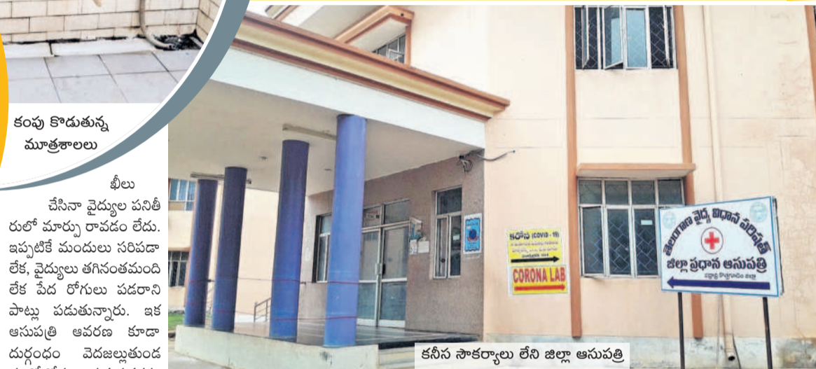
కనీస సౌకర్యాల లేని జిల్లా ఆసుపత్రి

ఫిర్యాదులు చేసినా ఆసుపత్రి వైద్యులు పట్టించుకున్న పాపాపాపాపాపా లేదని స్థానికులు, రోగులు ఆరోపిస్తున్నారు. ఇటీవల కొందరు ప్రజావాణిలోనూ ఫిర్యాదులు దుర్గంధం వెదజల్లుతున్నాయి.