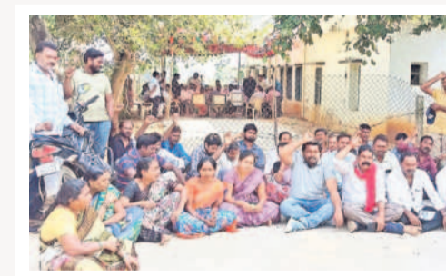
జూలూరుపాడు ఎంపీడీవో కార్యాలయం ముందు ధర్మా చేస్తున్న పంచాయతీ కార్యకర్లు

కనీస వేతనం రూ.28 వేలు ఇవ్వాలి.. మల్టీపర్ఫర్మన్ విధానం రద్దు చేయాలి.. ఉద్యోగాలను పరిశీలించే చేయాలి.. పెండింగ్ జీతాలను వెంటనే విడుదల చేయాలని కోరుతూ పంచాయతీ కార్యకర్లు ముక్తకంఠంతో రాష్ట్ర ప్రభుత్వాన్ని డిమాండ్ చేశారు. శనివారం రెండోరోజు వారు నిర్వహించిన టోకెన్ సమ్మె ఖమ్మం ఉమ్మడి జిల్లావ్యాప్తంగా ముగిసింది. ఈ సందర్భంగా సమ్మె శిబిరాల్లో నాయకులు మాట్లాడుతూ ప్రభుత్వం స్పందించి వెంటనే పంచాయతీ కార్యకర్ల సమస్యలను పరిష్కరించకపోతే వచ్చేనెల 4వ తేదీ నుంచి నిరవధిక సమ్మెకు వెనుకాడబోమని హెచ్చరించారు. భవిష్యత్తులో పెద్దపత్తున నిరసన కార్యక్రమాలు చేపామని తెలిపారు. పంచాయతీ కార్యకర్ల శ్రమను గుర్తించాలని కోరారు. ఎన్నికల సమయంలో ఇచ్చిన హామీలను వెంటనే నెరవేర్చాలని డిమాండ్ చేశారు. గ్రామ పంచాయతీల్లో పాలిశుద్ధ్య, విద్యుత్, నీటి సరఫరా పనుల్లో మల్టీపర్ఫర్మన్ పర్ఫర్మన్ కార్యకర్లు పగలసకా రాత్రుసకా వెళ్లిచాకిరి చేస్తున్నారన్నారు. నెలనెలా వేతనాలు సరిగా అందకపోవడంతో తీవ్ర ఆర్థిక ఇబ్బందులు పడుతున్నారని బాధను వ్యక్తంచేశారు. ఆయా కార్యక్రమాల్లో నిబటియూ, ఏబిటియూసీ నాయకులు, పంచాయతీ కార్యకర్లు పాల్గొన్నారు. - నమస్తే నెట్వర్క్