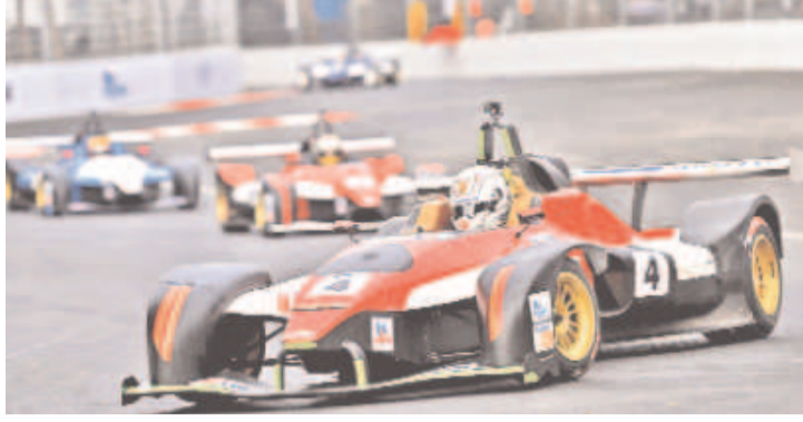
సీజన్ కుడా హైదరాబాద్లో నిర్వహించడానికి తీసుకున్న ఒక విధానపరమైన నిర్ణయం మాత్రమే అని కేటీఆర్ పేర్కొన్నారు.

హైదరాబాద్, డిసెంబర్ 28 (నమస్తే తెలంగాణ): ఫార్ములా ఈ-రేస్ కేసులో ప్రభుత్వం తప్పనే చేస్తున్నది ఉద్దేశపూర్వక, నిరాధారమైన నిందారోపణలే తప్ప, నిజాలు ఎంతమాత్రం లేవని టీఆర్ఎస్ పార్టీ వర్గం ప్రసిడెంట్ కె. తారకరామారావు పేర్కొన్నారు. సర్కార్ మోపిన అబద్ధాలను తాను ఎట్టి పరిస్థితుల్లో అంగీకరించేదీ లేదని స్పష్టంచేశారు. ఫార్ములా ఈ-రేస్ పై ప్రభుత్వం చేస్తున్న వాదనను తిరస్కరించారు. ప్రభుత్వం చేస్తున్న ఆరోపణలపై ఆయన పైకొద్దలో కౌంటర్ దాఖలు దాఖలు చేశారు. తప్పనే నిజంలేదని కౌంటర్లో బదులిచ్చారు. ఫార్ములా ఈ-రేస్ సీజన్-10 నిర్వహణకు స్పాన్సర్ లేక పోవడం వల్లే ప్రభుత్వం నిర్ణయం తీసుకోవాలి వచ్చిందని వివరించారు. 'ఈ మొత్తం వ్యవహారంలో కుట్ర లేదు. అవినీతి అంతా కన్నా లేదు. ఎలక్షన్ కమిషన్ నిర్ణయం తీసుకున్నాను. హైదరాబాద్ ప్రతిష్టను పెంచడం కోసం తీసుకున్న నిర్ణయం మాత్రం. ఫార్ములా ఈ-రేస్ మరో