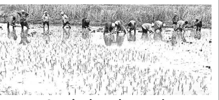
సోన మండల కేంద్రంలో వరి నాట్లు వేస్తున్న ముఖా కుర్రులు