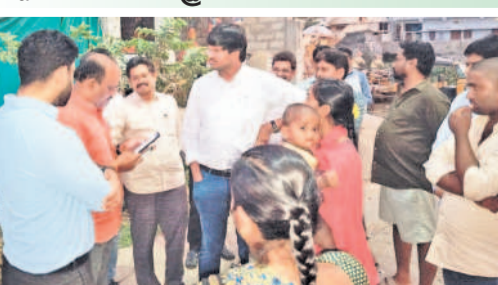
ఖమ్మం రూరల్: సర్వేను పరిశీలిస్తూ హోజింగ్ శాఖ ఎండ్ గౌతమ్

ఖమ్మం రూరల్, డిసెంబర్ 27: ఇందిరమ్మ ఇళ్ల సర్వేను పక్కనబెట్టిగా నిర్వహించాలని రాష్ట్ర హోజింగ్ శాఖ ఎండ్ గౌతమ్ సూచించారు. ఇందిరమ్మ ఇళ్ల కోసం దరఖాస్తు చేసుకున్న వారి ఇళ్లకు వెళ్లి నిబ్బంది చేస్తున్న సర్వేను ఖమ్మం రూరల్ మండలంలో శుభ్రవారం ఆయన పరిశీలించారు. మండల కేంద్రమైన జలగంనగర్లో సంబంధిత అధికారులతో కలిసి వెళ్లి సర్వే నిబ్బందితోనూ, దరఖాస్తుదారులతోనూ మాట్లాడారు. సర్వేకు వెళ్లే ముందు ఇందిరమ్మ ఇళ్ల దరఖాస్తుదారులకు ముందస్తు సమాచారం ఇవ్వాలని సూచించారు. దరఖాస్తుదారులు కూడా అవసరమైన పత్రాలను సిద్ధం చేసుకొని ఉండాలని, సర్వే కోసం వచ్చే ఎన్నామరేలు ద్రోశ సహకరించాలని కోరారు. ఎన్నామరేలు కూడా ప్రతిజ్ఞ తమకు నిర్దేశించిన లక్ష్యం మేరకు సర్వేను పూర్తి చేయాలని ఆదేశించారు. ప్రతి దరఖాస్తుదారుడి ఇంటికి వెళ్లి ప్రస్తుత స్థితిగతులు తెలిసేలా ఫోటో తీసి యావట్ అవలోడ్ చేయాలని సూచించారు. డాక్యుమెంట్ల ప్రకారం