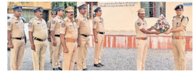
ఎర్రపాలెం పోలీస్ స్టేషన్ సందర్శనలో సీపీ సునీల్ దత్

ఎర్రపాలెం, డిసెంబర్ 27: జిల్లా, రాష్ట్ర పరిపాలన నుంచి అక్రమ రవాణాను నియంత్రించేందుకు స్పెషల్ డైరీ నిర్వహించాలని సీపీ సునీల్ దత్ సూచించారు. వాహనాల తనిఖీలు కూడా ముమ్మరం చేయాలని ఆదేశించారు. ఎర్రపాలెం పోలీస్ స్టేషన్ ను శుభ్రవారం సందర్శించిన ఆయన.. స్టేషన్ నిర్వహణ, పోలీసుల పనితీరు, సిక్సర్ అధికారుల వివరణ నివేదికలు, జనరల్ డైరీ రికార్డులు తదితరాలను పరిశీలించారు. పీవీఎస్ వివరణల అవకాశ గురించి సిబ్బందితో చర్చించారు. పోలీస్ స్టేషన్ పరిధిలో పనిచేసే కేసులు, కరువు 100 క్యాట్ ప్రతిస్పందన సమయం, సస్పెండ్ డీవీలు, పెండింగ్ కేసులు వంటి వాటిని పరిశీలించారు. 'పెల్లెకార్, బీట్ డ్యూటీ సిబ్బంది ఏ విధమైన విధులు నిర్వహిస్తున్నారు? పాత నెరవేరు నివాసాలను కడలికలను ఏ విధంగా గుర్తిస్తున్నారు?' అడిగి పోలీసులను తెలుసుకున్నారు. ఈ సందర్భంగా ఆయన మాట్లాడుతూ.. స్టేషన్ హౌస్ మేనేజ్మెంట్, పోలీస్ స్టేషన్ నిర్వహణ, సిక్సర్ ఆఫీసర్ బాధ్యతలు, రెగ్యులర్ రోల్ కార్ వంటి వాటిని విధిగా అమలు చేయాలని సూచించారు. ఎన్సి పి.వెంకటేశ్వర్లు, పోలీసు సిబ్బంది పాల్గొన్నారు.