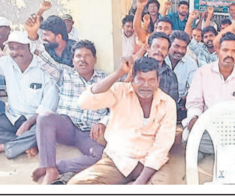
ఎర్రపాలెంలో టోకెన్ సమ్మెలో పాల్గొన్న పంచాయతీ కార్మికులు