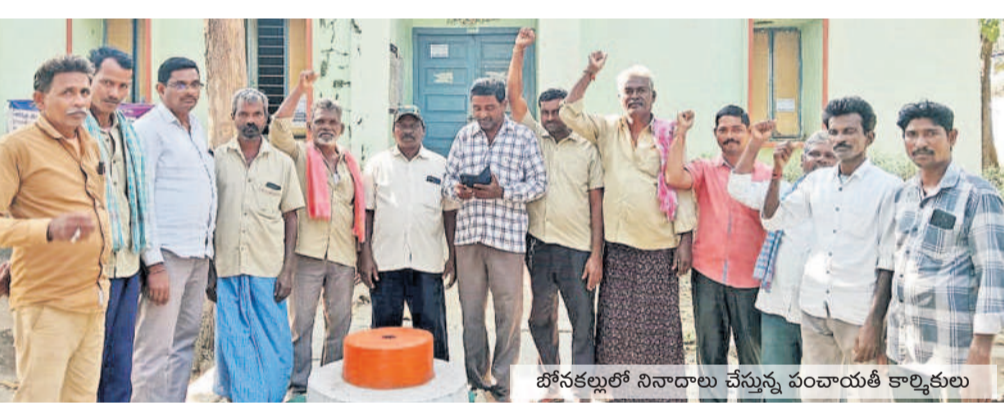
పోనకల్లోని నినాదాలు చేస్తున్న పంచాయతీ కార్మికులు

తమకు ఇబ్బంది రాకుండా ఉండడం కోసం రెండు రోజులు సమయం తీసుకుని ఒక వ్యాసం ప్రకారం నలుగురిపై ఒక ప్రత్యేక ఉపాధ్యాయుల పదోన్నతుల విషయాన్ని 'సమస్య' వెలుగులోకి తెవడంతో ఉలిక్కిపడిన డీకాట్ కార్యాలయం వెనువెంటనే దిద్దుబాటు చర్యలు చేపట్టింది. అర్హత లేకున్నా సర్టిఫికెట్లు సమర్పించి పదోన్నతులు పొందిన వారిపై చర్యలు తీసుకోవడంతోపాటు వారికి మరూమూల ప్రాంతంలో రివర్స్ పోస్టింగ్ ఇవ్వాలి ఉంది. కానీ, దానికి భిన్నంగా వారిని బయ్యగించి.. వారిపై ఎలాంటి