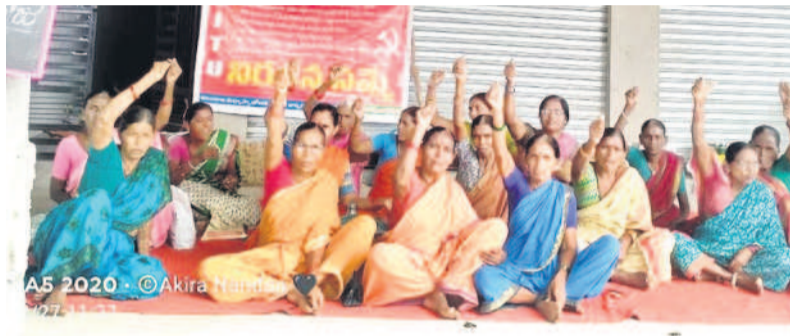
దస్తరాబాద్: నివాదాలు చేస్తున్న మధ్యాహ్న భోజన కార్యక్రమం

పెరిగిన ధరలకు అనుగుణంగా మేన్ చార్జీలను పెంచాలని, ఎన్నికల్లో ఇచ్చిన హామీ ప్రకారం కార్యకర్తలకు కనీస వేతనం రూ.10 వేలను అందజేయాలని, ప్రతి పాఠశాలకూ గ్యాస్ సిలిండర్ అందజేయాలని డిమాండ్ చేశారు. ప్రమాద బీమా పీఎఫ్, ఈఎస్ఐ సౌకర్యాలను కల్పించాలని, షరతులు లేని రుణాలు అందజేస్తూ కార్యకర్తలకు అండగా ఉండాలన్నారు. దస్తు రాబాద్లోని ఎంపీడివో కార్యాలయం ఎదుట మధ్యాహ్న భోజన కార్యక్రమం సమయంలో భాగంగా నిరసన చేపట్టారు.