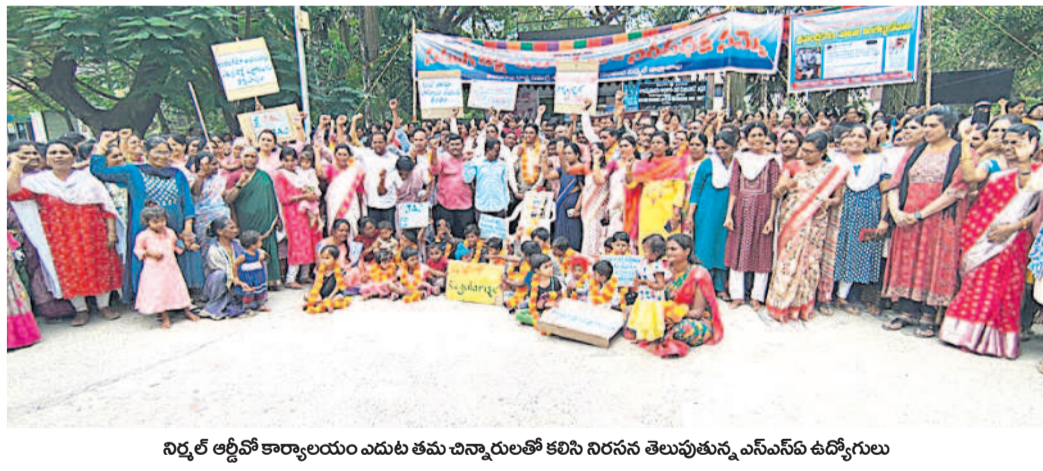
నిర్మల్ అర్బన్ కార్యాలయం ఎదుట తమ చిన్నాదులతో కలిసి నిరసన తెలుపుతున్న ఎన్ఎస్ఐ ఉద్యోగులు

ని వివాదాన్ని నిరసన తెలిపారు. సమస్య చేపట్టిన 18 రోజులైనా సీఎం రేపంట్లెడ్డి స్పందించక పోవడంపై సమగ్ర శిక్ష బోధన బోధనాధికారి సిబ్బందితో పాటు వంట సిబ్బంది విధులను బహిష్కరించి నిర్మల్ అర్బన్ కార్యాలయం ఎదుట నిరసన చేపట్టారు. ఈ సందర్భంగా వారు మాట్లాడుతూ సీఎం రేపంట్లెడ్డి ఇచ్చిన హామీ మేరకు తమను రెగ్యులర్ చేయాల