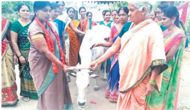
కడెంట్ అవుకు వినతిపత్రాన్ని అందజేస్తున్న మధ్యాహ్న భోజన కార్యక్రమం