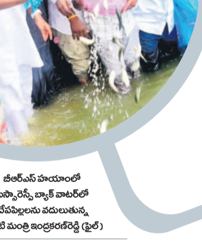
చీలెంపి హయాంలో ఎస్సారెస్సీ బ్యాక్ వాలర్లలో చేప పిల్లలను వదులుతున్న అప్పటి మంత్రి ఇంద్రకరణ్ రెడ్డి (డైలీ)

కాంగ్రెస్ ప్రభుత్వం ఈ సారి చేప పిల్లల పెంపకం విషయంలో అప్రవృత్త విధానాలు అమలు చేయడంతో పిల్లల పంపిణీ ప్రక్రియ ఆలస్యమైంది. దీంతో చేప పిల్లల పెంపకంపై నీలినీడలు