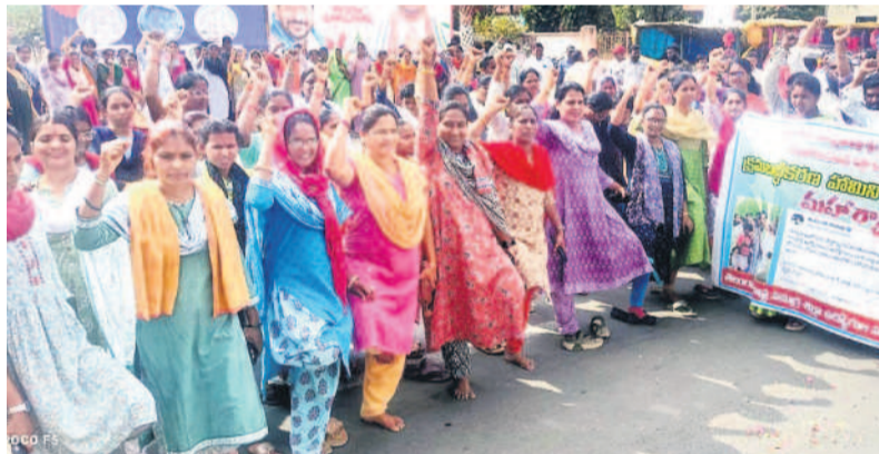
అదిలాబాద్లో ఒంటికాబిట్ల నిర్మాణ నిరసన తెలుపుతున్న ఉద్యోగులు