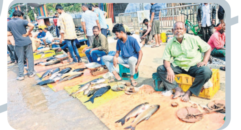
నిర్మల్ లోని చేపల మార్కెట్లో చేపలను విక్రయిస్తున్న మత్స్యకారులు

ఈ సారి చేప పిల్లలను పంపిణీ చేసేందుకు టెండర్ల దక్కించుకున్న కాంట్రాక్టర్ల ప్రభుత్వం నిర్దేశించిన సైజులో కాకుండా చిన్న సైజు చేప పిల్లలను పంపిణీ చేసినట్లు ఆరోపణలు ఉన్నాయి. 80 నుంచి 100 మిల్లీ మీటర్ల సైజు గల లక్ష చేప పిల్లలకు 1.75 లక్షలకు ప్రభుత్వం చెల్లిస్తుంది. 35 నుంచి 45 మిల్లీ మీటర్ల సైజు గల లక్ష చేప పిల్లలకు రూ.84వేలను చెల్లిస్తుంది. అయితే చేప పిల్లల పంపిణీ కోసం కాంట్రాక్టర్ల దక్కించుకున్న కొందరు చిన్న సైజు పిల్లలను పంపిణీ చేసి పెద్ద సైజు పిల్లలను పంపిణీ చేసినట్లు తెలుస్తున్నట్లు సమాచారం. పెద్ద సైజు పేరిట చిన్న సైజు చేప పిల్లలను వదిలివేసి ఆరోపణలున్నాయి. శాశ్వత నీటి వనరులు లభించే చెరువుల్లో బోర్లను 40 శాతం బోర్లు, 50 శాతం రహు, 10 శాతం మెరిగ రకం చేప పిల్లలను వదులుతారు. సీజన్ చెరువులు, అంటే ఆరు నెలల నుంచి 9 నెలల పాటు నీరు ఉండే చెరువుల్లో 35 మిల్లీ మీటర్ల నుంచి 40 మిల్లీ మీటర్ల సైజు గల చేప పిల్లలను మాత్రమే వదులుతారు. దీంతో ఆయా చెరువుల్లో బోర్లను 40 శాతం, రహు రకం 35 శాతం, బంగారు తీగ 30శాతం నిష్పత్తిలో చేప పిల్లలను వదులుతారు. ఈ సారి చేప పిల్లలను వదిలడం అలసత్వం కావడంతో వీటి పెంపకంపై అయోమయం నెలకొన్నది. మొత్తానికి ఈ ఏడాది చేప పిల్లల పంపిణీ తీవ్ర గందరగోళానికి దారితీయగా, మత్స్యకారుల ఉపాధిపై కూడా ప్రభావం చూపనున్నదని చెబుతున్నారు.