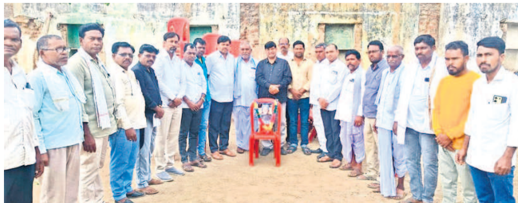
ఇంద్రవెల్లిలో మాజీ ప్రధాని మన్మోహన్ సింగ్ చిత్రపటం వద్ద నివాళులర్పిస్తున్న అఖిల పక్షం నాయకులు