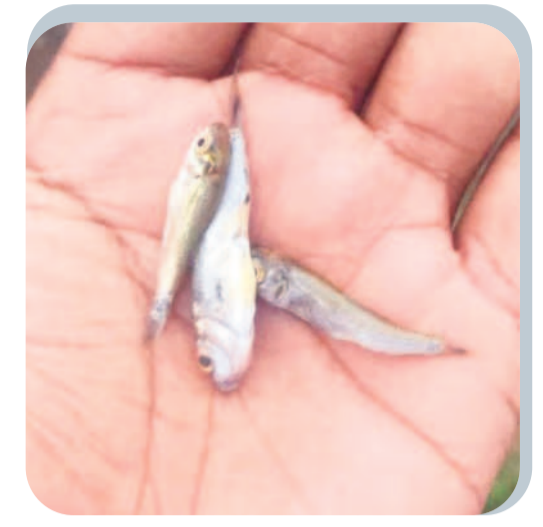
చనిపోయిన చేప పిల్లలను చూపుతున్న మత్స్యకారులు

చనిపోయిన చేప పిల్లలను చూపుతున్న మత్స్యకారులు దలు కమ్ముకున్నాయి. అలసత్వం చేప పిల్లలను వదిలివేసే కారణంగా చెరువులు, రిజర్వాయర్లలో చేపలు పెరిగేందుకు మరింత సమయం పట్టే అవకాశం ఉన్నది. ఈ క్రమంలో చెరువులు, రిజర్వాయర్లలో నీటి నిల్వలు తగ్గిపోయే అవకాశం ఉన్నది. వచ్చే మార్చి నెల నాటికి యాసంగి పంటల సాగుకు ఏకడాటిగా మూడు నెలల పాటు నీటిని విడుదల చేయటం ఉంటుంది. దీంతో చెరువులు ఎండిపోయే అవకాశం ఉండడంతో చేప పిల్లల పెంపకంపై తీవ్ర ప్రభావం పడుతుందని మత్స్యకారులు వాపోతున్నారు. ఇదే జరిగితే జిల్లాలోని 22 మత్స్యకార సాన్సెటిల్ ఏరియాల్లో ఉన్న 13 వేలకు పైగా మత్స్యకారుల ఉపాధికి గండిపడే అవకాశం ఉంటుంది.