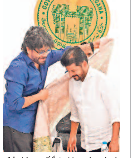
సీని ప్రముఖుల బోటీ సందర్భంగా ముఖ్యమంత్రి రేవంత్ కు శాలువా కప్పేతున్న సటుడు నాగార్జున

కొత్త చట్టంలో.. కొత్త చట్టం అమల్లోకి వచ్చిన తర్వాత భూమి అమ్మాలన్నా, కొనాలన్నా సర్వే తప్పనిసరిగా చేయించాలి ఉంటుంది. ఒక రైతు తన భూమిని అమ్మాలంటే ముందుగా సర్వే కోసం దరఖాస్తు చేసుకోవాలి. సర్వే యర్ వచ్చి, భూమిని కొలిచి హద్దులతో డిజిటల్ మ్యాప్ లను రైతుకు ఇవ్వాలి. ఆ తర్వాత స్టాంప్ బుక్ చేసుకొని, తహసీల్దార్ కార్యాలయానికి వెళ్లి రిజిస్ట్రేషన్ జరుగుతుంది.