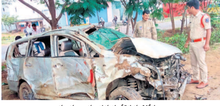
సుజ్ఞానులైన కారును పరిశీలిస్తున్న పోలీసులు

కుంటూ మరింత ఇక్కడను పెంచామని తెలిపారు. క్రీస్తుని, రంజాన్, దసరా పండుగలకు ప్రత్యేక విడుదలు, దుస్తులు, సామగ్రిని పండుతూ గంగా జమున తపాజీలకు నిలవాలని తెలంగాణ సమాజాన్ని తరచూ చేసిన ఘన కేసీఆర్ దే దక్కుతుందని పేర్కొన్నారు.