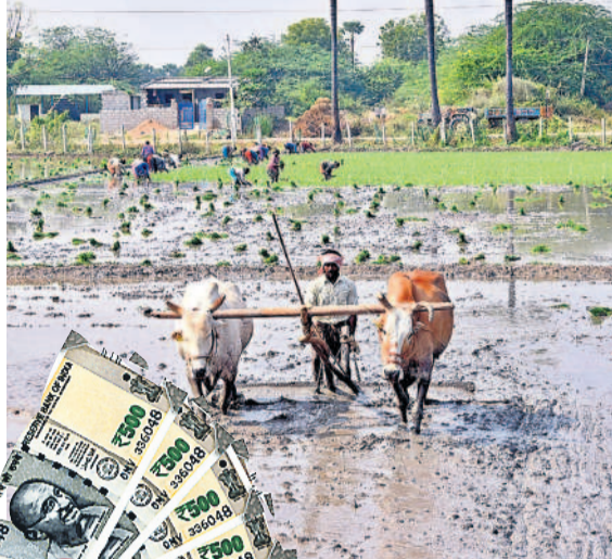
పంట వేయకుంటే అంతే సంగతులు...

ఎన్నికల ముందు అధికారం కోసం కాంగ్రెస్ పార్టీ ఇచ్చిన హామీలకు అధికారంలోకి వచ్చాక అమలు చేస్తున్న విధానాలకు పొంతన ఉండడం లేదు. ఆయా అధికారం కోసం అడ్డగిలుగా హామీలు ఇచ్చి ఓట్లను కొల్లగొట్టి... ప్రస్తుతం అదే ఓటర్లకు మొండిచెయ్యి చూపుతున్నది. అందరికీ 2 లక్షల వరకు రుణమాఫీ అని ఆర్కాటంగా ప్రకటించిన రేవంత్ రెడ్డి ప్రభుత్వం తీరా అమలుకు వచ్చే సరికి సగానికి సగం కోత పెట్టింది. ఇప్పటికీ ఉమ్మడి నల్లగొండ జిల్లాలో కనీసం రెండున్నర లక్షల మంది రైతులు రుణమాఫీ కోసం ఐదు నెలలుగా ఎదురుచూస్తూనే ఉన్నారు. ఎకరాకు రూ.1.5వేల పంట సాయం ఇచ్చే రైతు భరోసా పథకంపైనా నీలగిడలు కమ్ముకుంటున్నాయి. అధికారంలోకి వచ్చి ఏడాది దాటిగా వారు ప్రకటించిన రైతు భరోసా అందలేదు. గత యాసగిలో అమలు చేసినా, కేసీఆర్ సర్కార్ ఇచ్చిన రైతుబంధు పథకాన్నే ఎకరాకు రూ.5వేల చొప్పున ఇచ్చి చేతులు దులుపుకొన్నారు. వానకాలం నుంచి ఎకరాకు ఒక్కో సీజన్ కు రూ.7,500 ఇస్తామని చెప్పి అమలు చేసినా పెట్టారు. ఇప్పుడు యాసగి పంట కాలానికి సంక్రాంతి తర్వాత ఇస్తామని ప్రభుత్వం ప్రకటన చేసినా ఎంతమందికి ఇస్తారు, అందరికీ ఇస్తారు, లేదా అనే సందేహాలు సర్వత్రా నెలకొన్నాయి. గ్రామాల్లో ఏ ఇద్దరు రైతులు కలిసినా రైతు భరోసా ఇచ్చేనా? ఇస్తే ఎన్ని ఎకరాల వరకు ఇస్తారు? ఎవరికి కోత పెడుతారు? అన్న చర్చ నడుస్తున్నది.