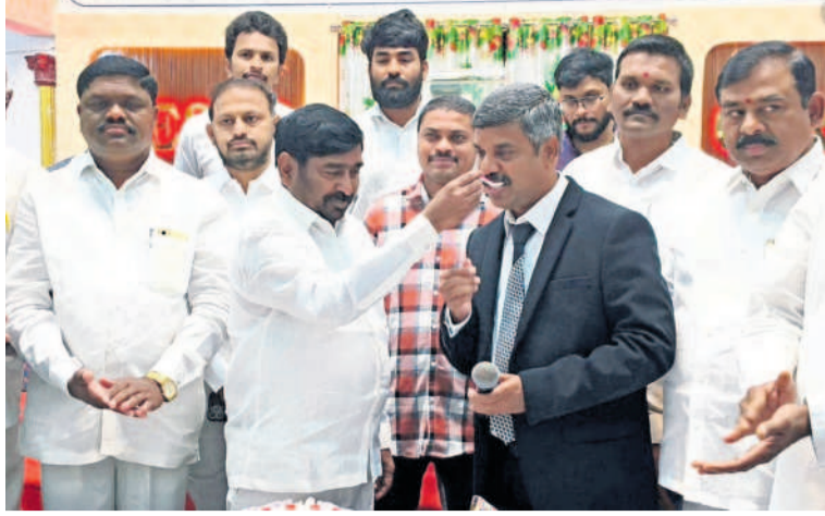
సూర్యాపేట గ్రేస్ చర్చిలో కేసు కట్ చేసి పాస్టరుకు తినిపిస్తున్న మాజీ మంత్రి గుంటకండ్ల జగదీశ్ రెడ్డి

వానకాలంలో సాగు చేసే యాసగిలో సాగు చేయని భూములకు రైతు భరోసా ఇవ్వరన్న చర్య ప్రభుత్వ వర్గాల నుంచి వినిపిస్తున్నది. వ్యవసాయ శాఖ మంత్రి మల్లం నాగేశ్వరరావు ఇటీవల అమలు సాగులో లేని భూముల కింద చూపించినట్లు సమాచారం. ఇదే జరిగితే రైతు భరోసాకు మెట్ల భూముల రైతులంతా దూరం కానున్నారు. సాధారణంగా జిల్లాలో వరి, పండ్ల తోటలు మినహా మిగతా పంటలన్నీ వానకాలంలోనే సాగు చేస్తారు. పత్తి, జొన్న, ఇతర మెట్ల పంటలను ఏడాదిలో ఒకేసారి సాగు చేస్తారు. సంక్రాంతి వరకు ఈ పంటల దిగుబడి పూర్తవుతుంది. ఈ నేపథ్యంలో ప్రభుత్వం పంట వేయని రైతులకు భరోసా లేదంటే ఇప్పటి వరకు రైతుబంధు పొందిన రైతుల్లో 70 శాతం మంది అసర్దులు కానున్నారు. ఇదే జరిగితే ప్రభుత్వం ఇచ్చే రైతు భరోసా ఏ కొద్దిమంది రైతులకో అందతుంది. జరుగుతున్న పరిణామాలను పరిశీలిస్తే... రుణమాఫీ మాదిరిగానే రైతు భరోసాకు సైతం ప్రభుత్వం కోతలు పెడుతుందన్న భయం రైతులను వెంటాడుతున్నది. భూమి ఉన్న ప్రతి రైతునూ సాగు వైపు మళ్లించాలని, తద్వారా బీడు భూములను సైతం సాగులోకి తీవాలని, పంటల దిగుబడిని ప్రోత్సహించాలని 24 గంటల ఉపేక్ష కలెంటు, సాగు నీటికి తోడు రైతుబంధు కూడా అందిస్తే వ్యవసాయం పండుగలా మారుతుందని అప్పటి కేసీఆర్ సర్కార్ నిరూపిస్తే... ప్రస్తుత కాంగ్రెస్ ప్రభుత్వానికి ఇవేమి పట్టకపోవడం గమనార్హం. కేవలం రుణమాఫీని, రైతుభరోసా వంటి పథకాలను ఆర్థిక పరమైన అంశాలుగానే భావిస్తూ భారం తగ్గించుకునేందుకు మాత్రమే అలోచిస్తుండడం పట్ల రైతు సంఘాల నాయకులు, వ్యవసాయ రంగ నిపుణులు మండిపడుతున్నారు. ఎలాంటి పథకాలూ లేకుండా గతంలో మాదిరిగానే ప్రతి రైతుకూ రైతుభరోసా ఇవ్వాలని డిమాండ్ చేస్తున్నారు.