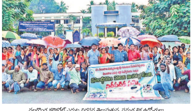
నల్లగొండ కలెక్టరేట్ ఎదుట నిరసన తెలుపుతున్న సమగ్ర శిక్ష ఉద్యోగులు

ఉంటుంది. కానీ అటూఇటూ ఈ సీజన్లో రూ.700 నుంచి 800 కోట్ల వరకు ఇస్తే గగనమని ప్రభుత్వ చర్యలను బట్టి తెలుస్తున్నది. పీఎం కిసాన్ సమ్మాన్ నిధి నిబంధనలను అమలు చేస్తే ఇంట్లో ఒక రైతుకు మాత్రమే రైతు భరోసా వర్షంవస్తుంది. ఒక కుటుంబంలో ఇద్దరు ముగ్గురు రైతుల పేర్లపై భూమి ఉంటే అందులో ఒక్కరికే రైతుభరోసా ఇచ్చే అవకాశం ఉంది. రుణమాఫీ మాదిరిగానే కనీసం రెండేండ్లు పట్టి కట్టిన వారికి రైతు భరోసా రాకపోవచ్చు. ఇక ప్రజాప్రతినిధులు, ప్రభుత్వోద్యోగులు, పెన్షన్లపై, డాక్టర్లు, ఇంజనీర్లు, లాయర్లు, వార్షిక ఆటోమొట్టు, ఆర్టికల్స్, ఇతర ప్రాఫెషనల్ వృత్తులకు సైతం రైతు భరోసా వర్షం వరకపోవచ్చు.