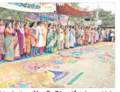
సమ్మె శిబిరం వద్ద రోడ్డు పువ్వులు వేసి ఎస్ఎస్ఏ ఉద్యోగినుల నిరసన