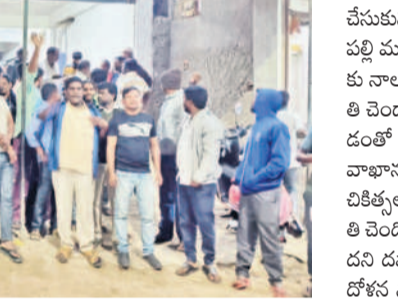
దమాఖాన ఎదుట ధర్మా చేస్తున్న కుటుంబ సంఘాలు

పెచ్చేరు, డిసెంబర్ 25 : మహిళా మెడలో బంగారం బోలిక పట్టుగలే గుర్తు తెలియని వ్యక్తులు యత్నించిన సంఘటన వనపర్తి జిల్లాలో చోటు చేసుకున్నది. బాదితులాలి కడసం మేరక.. పెచ్చేరు పట్టణంలోని బీసీ కాలనీ రోడ్డులోని విన్నపెంటు అనే మహిళా పండ్లు అమ్ముకొని జీవనం సాగిస్తుంది. బుధవారం ఉదయం తన పండ్ల బండిని సిద్దం చేసుకుంటున్న తరుణంలో మురికి క్యాబులు ధరించి మోటర్ సైకిల్ పై వచ్చిన దుండగులు ఆమె మెడలోని గొలుసును లాక్క నేడుకు ప్రయత్నించారు. ఈ క్రమంలో ఆమె గట్టిగా కేకలు వేసి పెనుగలాడటంతో దొంగలు ఆమెను వదిలి పరారయ్యారు. వైద్యంగా దొంగలను ప్రతిఘటించిన ఆ మహిళను స్థానికులు ఆధిసించారు.