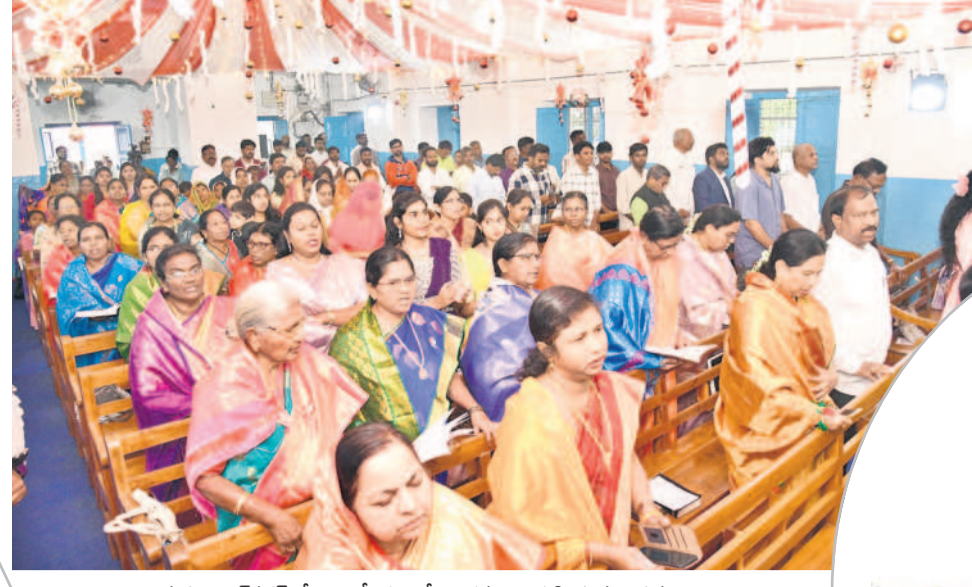
మహబూబ్ నగర్ లోని ఎంబీ చర్చిలో ప్రార్థనలు నిర్వహిస్తున్న ప్రైవేటులు