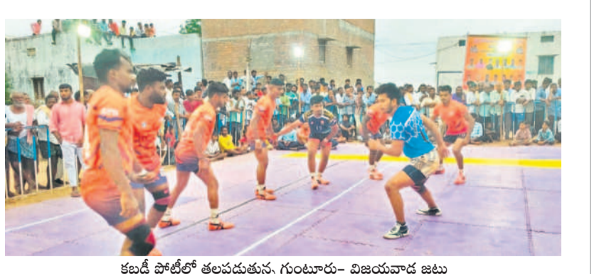
కబడ్డీ పోటీలో తలదడుతున్న గుంటూరు - విజయవాడ జట్లు