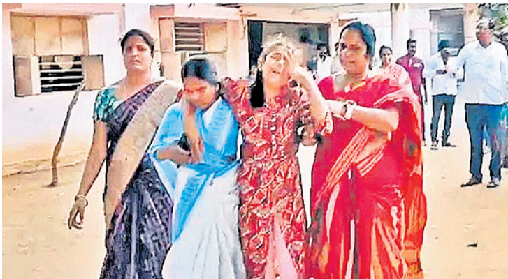
సరిగా అమలుకావడం లేదు. ఫలితంగా 2024 లో 362 మంది రైతులు ఆత్మహత్యలు చేసుకున్నారు. ఈ చావులకు ఎవరు బాధ్యులు? ఎవరి మీద కేసులు వేయాలి?

వ్యతిరేకుల మీద కేసులు పెట్టినప్పుడు రాజకీయ నాయకులు తరచూ చెప్పే మాట 'చట్టానికి మట్టాలుండరు, చట్టం తన పని తాను చేసుకుపోతుంది, చట్టం దృష్టిలో అందరూ సమానులే'. వినటానికి, నమ్మటానికి ఇది చాలా బాగుంటుంది. మరి ఆచరణలో అలాగే జరుగుతుందా? ఏదైనా అనుకోని బలవస్తరణం, యాక్సిడెంట్ జరిగినప్పుడు ఎవరి వల్ల జరిగిందో వారే బాధ్యులని చెప్పుంటారు. కానీ, ఇప్పుడు అన్ని టీవీ ఛానళ్లలో మార్కోగొతున్న మాటలు, కథనాలు, చర్చలు అల్లు అడ్డం సంధ్య థియేటర్లకు వెళ్లినప్పుడు జరిగిన ఘటన చుట్టూ తిరుగుతున్నాయి. రాజధానిలోని అసెంబ్లీ నుంచి, మారుమూల పల్లెటూరులోని గట్టి చరకు వాదోపవాదాలు జరుగుతున్నాయి. కేసు కోర్టు దాకా వెళ్లింది. కాబట్టి, న్యాయమూర్తులు న్యాయంగా తీర్పు చెప్పారని ఆశించాలి!