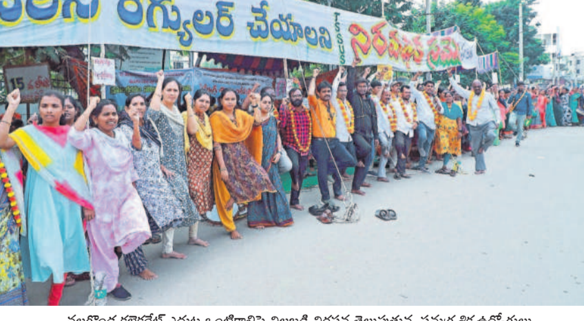
నల్లగొండ కలెక్టరేట్ ఎంబు జంటికాల్లపై నిలబడి నిరసన తెలుపుతున్న నమగ్గ శిక్ష ఉద్యోగులు

నల్లగొండలోని లక్ష్మీగార్వెన్లో మూడు రోజులపాటు నిర్వహణ విద్యారంగంలోని అసమానతలు, అంతరంగాలపై చర్చ ఎమ్మెల్యే అల్లుబెల్లి నల్లరెడ్డి నీలగిరి, డిసెంబర్ 24 : ఈ నెల 28 నుంచి 30 వరకు నల్లగొండ జిల్లా కేంద్రంలోని లక్ష్మీగార్వెన్లో టీఎన్ యూటీఎఫ్ 8వ రాష్ట్ర విద్యా వెజ్జానిక మహాసభలు నిర్వహించనున్నట్లు ఎమ్మెల్యే అల్లుబెల్లి నల్లరెడ్డి అన్నారు. మూడు రోజులపాటు జరిగే ఈ మహాసభల్లో విద్యారంగంలో అసమానతలు, అంతరాలకు అంక్షలు చేస్తే అధికారులు కాంగ్రెస్ నేతల విషయంలో మాత్రం మానీ చూడనట్లు వ్యవహారించడం విమర్శలకు తావిస్తున్నది.