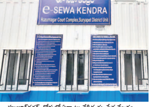
హుజూర్ నగర్ కొద్దులో ఏర్పాటు చేసిన ఈ-సేవ కేంద్రం

హుజూర్ నగర్, డిసెంబర్ 24 : పట్టణంలోని కొద్దుల కక్షిదారుల కోసం ఈ-సేవ కేంద్రాన్ని ఏర్పాటు చేశారు. హైకోర్టు ప్రధాన న్యాయమూర్తి జస్టిస్ అల్తోక అరాదే మంగళవారం ఈ-సేవ కేంద్రాన్ని పర్యవేక్షణ ప్రారంభించారు. రాష్ట్రంలోని వివిధ న్యాయ స్థానాల్లో ఏర్పాటు చేసిన 29 ఈ-సేవ కేంద్రాలను ఆయన ప్రారంభించారు. ఈ కేంద్రాల వల్ల జైలులో ఉన్న ఖైదీలతో వారి కుటుంబ సభ్యులను ములాఖత కావచ్చు. కోర్టులోని రికార్డుల కలెక్షన్ కేంద్రం ద్వారా పొందవచ్చు. దీంతో కక్షిదారులకు న్యాయస్థానాల కార్యకలాపాలు మరింత చేరువ కానున్నాయి.