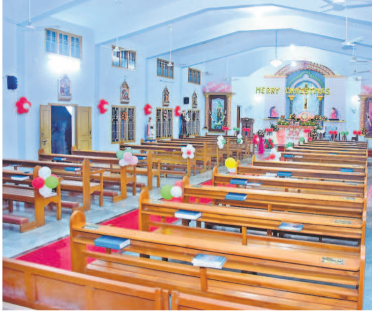
క్రీస్తు వేడుకలకు సిద్దమైన భువనగిరిలోని పుస్తా బోధిషు దేవాలయం