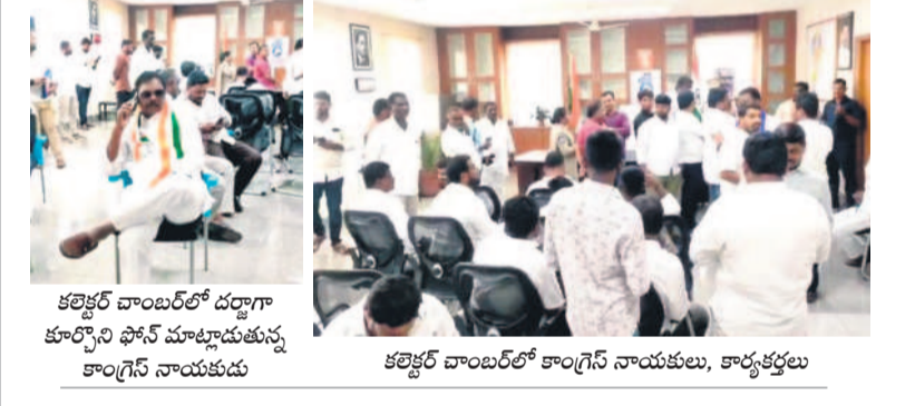
కలెక్టర్ వాంబరలో దర్జాగా కూర్చోని ఫోన్ మాట్లాడుతున్న కాంగ్రెస్ నాయకుడు