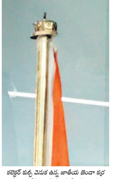
కలెక్టర్ కుర్చీ వెనుక ఉన్న జాతీయ జెండా కర్ర పైనుంచి పడిపోయిన మూడు నింహాల చివ్వాం