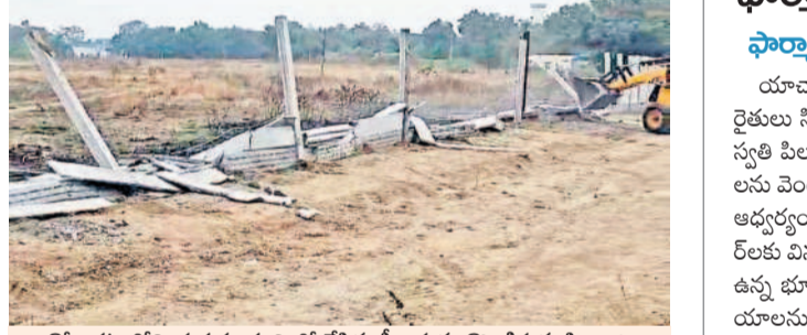
కోలకట్టలోని ప్రభుత్వ భూమిలో వేసిన ద్రామాస్టు కొలకట్టను నిర్మించి

ముజాహిదా పాఠశాల విద్యార్థినులు రాష్ట్రస్థాయి రన్నర్ పోటీల్లో పాల్గొని విజయం సాధించారు. ముజాహిదా పాఠశాల విద్యార్థినులు రాష్ట్రస్థాయి రన్నర్ పోటీల్లో పాల్గొని విజయం సాధించారు.