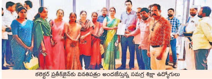
కలకత్తా ప్రతీకత్వ వినోదం అందజేస్తున్న సమగ్ర శిక్షణ ఉద్యోగులు