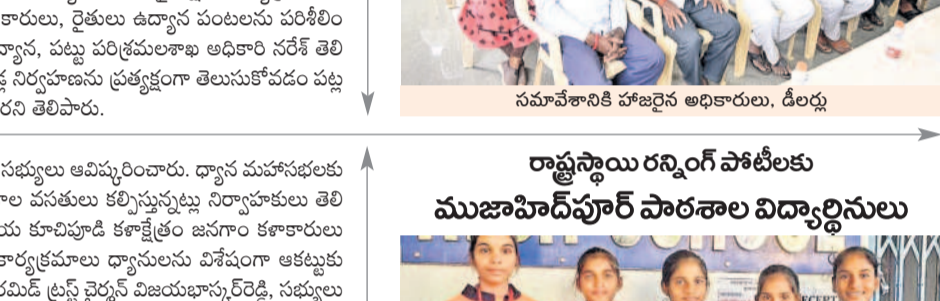
సమావేశానికి హాజరైన అధికారులు, డిలర్లు

ముజాహిదా పాఠశాల విద్యార్థినులు రాష్ట్రస్థాయి రన్నర్ పోటీల్లో పాల్గొని విజయం సాధించారు. ముజాహిదా పాఠశాల విద్యార్థినులు రాష్ట్రస్థాయి రన్నర్ పోటీల్లో పాల్గొని విజయం సాధించారు.