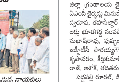
జూలపల్లి: కాచాపూర్లో నివాసాల నిర్మాణం నాయకులు