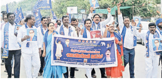
గోదావరిఖని: నిరసన ర్యాలీలో పాల్గొన్న నాయకులు