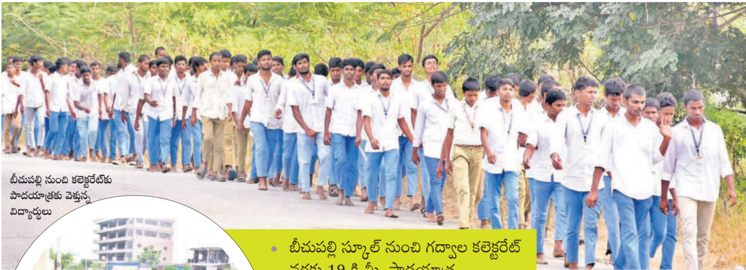
బీచుపల్లి నుంచి కల్వరేట్ కు పాదయాత్రకు వెళ్తున్న విద్యార్థులు