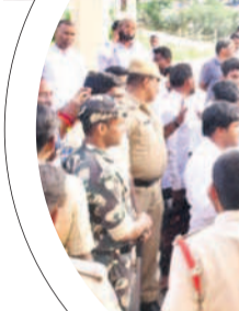
కల్వరేట్ వద్ద పోలీసులు అడ్డుకోవడంతో అక్కడే బైటాయింపిన విద్యార్థులు

గద్వాల/ఎ భవల్లి చౌరస్తా, డిసెంబర్ 24 : 'మా ప్రాస్టిట్యూట్ చర్యలు తీసుకోండి.. విద్యార్థులు పట్ల అసహనం ప్రకటించండి.. విద్యార్థులను మానసిక క్షోభకు గురిచేస్తూ వేదింపులకు పాల్పడుతుంది.. అతడి నుంచి తమకు రక్షణ కల్పించండి.. పాఠశాలలో మేనా ప్రకారం భోజనం పెట్టడం లేదు.. అని ఆగ్రహంతో బీచుపల్లి గురుకుల పాఠశాల, కళా శాల విద్యార్థులు ఆందోళనకు దిగారు. తమ బాధలు కల్వరేట్ దృష్టికి తీసుకు వెళ్లమని మంగళ వారం పాఠశాల నుంచి గద్వాల కల్వరేట్ వరకు 19 కిలోమీటర్లు 100 మందికిపైగా విద్యార్థులు పాద యాత్రగా చేరుకున్నారు. కల్వరేట్ ను కలవడానికి పెద్ద ఎత్తున రావడంతో గేటుకు తాళం వేయడంతో విద్యార్థులు గేటు బయటే బైటాయిం చేశారు. బీచుపల్లి విద్యార్థులు కల్వరేట్ దృష్టికి తీసుకు వెళ్లడంతో పోలీస్ కుార్వోబెట్టిడి మాట్లాడుతూ.. అని చెప్పి గంతుపట్టగా కూర్చోబెట్టారు. కల్వరేట్ తమ బాధలు చెప్పుకుందామని వస్తే అలసనం చేయడంపై విద్యార్థులు ఆస పనం