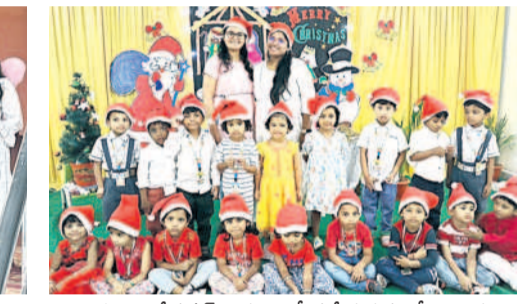
అద్విక ఇంటర్మీడియట్ పాఠశాలలో ప్రత్యేక దుస్తుల్లో విద్యార్థులు