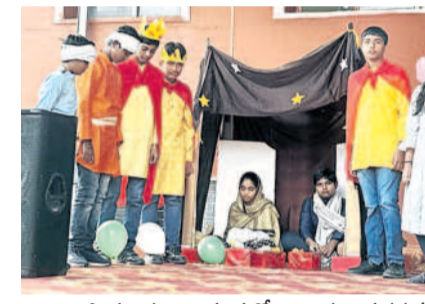
పాపమన విద్యాసంస్థలో విద్యార్థులు ప్రదర్శన

కమాన్‌వెల్త్స్, డిసెంబర్ 24 : జిల్లా కేంద్రంలోని పలు విద్యాసంస్థల్లో మంగళవారం ముందస్తు క్రీస్తుని వేడుకలు ఘనంగా నిర్వహించారు. ఇందులో భాగంగా, అల్లర్ల, పాపమన, అద్విక, బూజుపల్లె, సిద్ధార్థ విద్యాసంస్థల్లో చిన్నారులు చేసిన నృత్యాలు అకట్టుకున్నాయి. వారు పాడిన గీతాలు అలరించి చాయి. క్రీస్తున సందర్భంగా విద్యార్థులకు క్రీస్తుని చెబుతూ తయారీ, చిత్రకలపాదం పోటీలు నిర్వహించి బహుముతులు అందజేశారు. చిన్నారులు ప్రత్యేక దుస్తుల్లో హాజరై సందడి చేశారు.