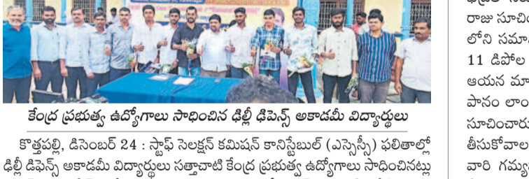
కేంద్ర ప్రభుత్వ ఉద్యోగాల సాధించిన ధీల్లీ డిఫెన్స్ అకాడమీ విద్యార్థులు

కొత్తపల్లి, డిసెంబర్ 24 : స్టాఫ్ సెలక్షన్ కమిషన్ కానిస్టేబుల్ (ఎస్సీసీ) ఫలితాల్లో డిఫెన్స్ అకాడమీ విద్యార్థులు సత్కారాలే కేంద్ర ప్రభుత్వ ఉద్యోగాల సాధించినట్లు చైర్మన్ కొత్త పత్రికల్ వేర్పాట్లు. మంగళవారం ధీల్లీ డిఫెన్స్ అకాడమీలో ఏర్పాటు చేసిన విలేజరుల సమావేశంలో అయిన వివరాలు వెల్లడించారు. ఈ నెల 19వ ప్రకటించిన స్టాఫ్ సెలక్షన్ కమిషన్ కానిస్టేబుల్ (జీడి) ఫలితాల్లో 21 మంది విద్యార్థులు ఉద్యోగాల సాధించారున్నారు. ఇందులో టీఎస్ఎస్ కు 10, సి.ఎస్ఎస్ కు 5, సి.ఎస్ఎస్ కు 3, ఎ.ఎస్ కు 2, ఎన్.ఎస్ఐ 1, ఇండియన్ ఎయిర్ ఫోర్స్ గ్రూప్-వై కు 2, కె.ఎస్ చొప్పున ఎంపికయ్యారున్నారు. వీరితో పాటు అల్లర్లలో వెలువడిన ఇండియన్ సీబీ ఎస్ఎస్ఎల్లో ఐదుగురు విద్యార్థులు ఉద్యోగాల సాధించారున్నారు. విద్యార్థులకు ఎంపిక విధానానికి ఏర్పాటు ఉద్యోగాలను శారీరకంగా, మానసికంగా సిద్ధం చేయడంతోనే ఉత్తమ ఫలితాలు సాధించారున్నారు. రాష్ట్రంలోనే అత్యుత్తమైన బోధనా ప్రమాణాలతో శిక్షణలను అందిస్తున్నట్లు తెలిపారు. డిఫెన్స్ రంగంలో వెలువడి ప్రతి టోపికాల్లో విద్యార్థులు ఉద్యోగాల సాధించడం గర్వంగా ఉందన్నారు. ఈ విద్యా సంవత్సరం నుంచి అమ్మాయిలకు ప్రత్యేకంగా సహకార కార్యక్రమం ఏర్పాటు చేసి డిఫెన్స్ ఉద్యోగాలకు కోచ్ గా ఇప్పుడున్నట్లు తెలిపారు. కార్యక్రమంలో విద్యార్థుల తల్లిదండ్రులు, అధ్యాపకులు పాల్గొన్నారు.