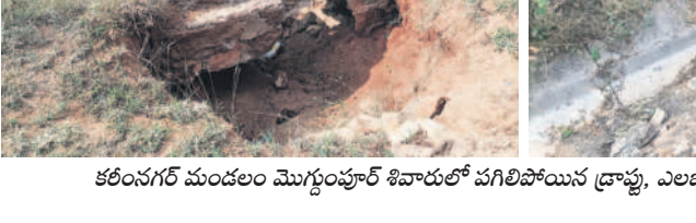
కలింగగర్ మండలం మొగ్గుంపూర్ శివారం పగిలిపోయిన డ్రాఫ్టు, ఎలబోతారం వద్ద కాలవలో బండ రాళ్లు

అడ్డంగా ఉన్నాయి. కలింగగర్ మండలంలోని ఇరుకల్లు, మొగ్గుం పూర్, ఎలబోతారం గ్రామాల పరిధిలో చూస్తే ఈ కాలవల నుంచి నీళ్లు ఎలా పారుతాయనే సందేహాలు తప్పక వ్యక్తమవుతాయి. డి-89 కాలవ పెద్దపల్లి జిల్లా సుల్తానాబాద్ మండలంలోని సాంబయ్యపల్లి, గొల్లపల్లి వరకు వెళ్తుంది. ఈ గ్రామాల్లో సైతం ప్రధాన కాలవ పరిస్థితి అధ్యాసంగా ఉన్నది. కాలవలకు వైదిన గండ్ల పూడికపోతే కలింగగర్, సుల్తానాబాద్ మండలంలోని చివరి ఆయకట్టుకు నీళ్లు వచ్చే పరిస్థితి లేదు. డి-89 ప్రధాన కాలవ పరిధిలోని ఉప కాలవల పరిస్థితి కూడా ఇందుకు భిన్నంగా ఏమీ లేదు. ఇక డి-94 ప్రధాన కాలవ ద్వారా కలింగగర్, ఆరెపల్లి, తీగలగుట్టపల్లి, పల్లంపహాడీ వరకు ముగ్గుంపల్లి నిదులలో పూడిక పనులు చేశారు. అక్కడి వరకు బాగానే ఉన్న కాలవ ఆ తర్వాత అధ్యాస పరిస్థితిలో ఉంది.