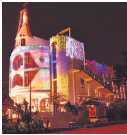
ముస్తాబైన క్రీస్మియన్ కాలనీలోని చర్చు