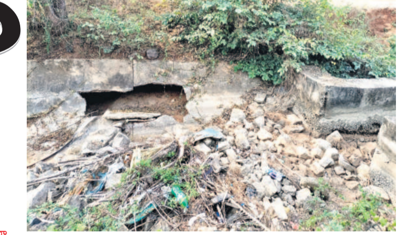
కలింగగర్ మండలం ఎలబోతారం వద్ద చెబ్బిళ్లు డి-89 ప్రధాన కాలవ