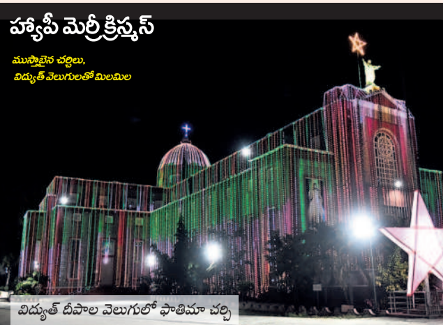
విద్యుత్ దీపాల వెలుగులో ఫాతిమా చర్చి