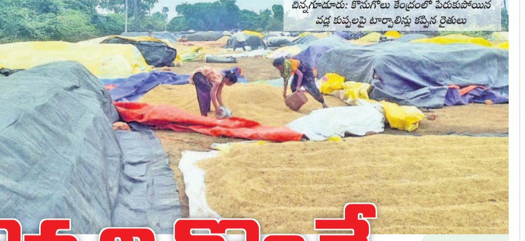
విన్నగూడూరు: కొనుగోలు కేంద్రంలో పేరుకుపోయిన వడ్లకుప్పలపై టార్నాల్స్ కప్పిన రైతులు

అన్నదాతల విషయంలో రాష్ట్ర ప్రభుత్వ తీరు 'చేసింది పినరంజన్' అన్న చందంగా మారింది. చివరి ధాన్యపు గింజవరకు కొంటామని అర్థాటంగా ప్రధానాధికారి తప్ప... అచరణలో కనిపించడం లేదు. వరికొత్తలు పూర్తయి దాదాపు నెల రోజులు కావాలన్నా ఇప్పటివరకు సగం ధాన్యం కూడా కొనలేదు. ఎందుకు ఎందుకూ, వానకు తరుస్తున్న ధాన్యాన్ని కాపాడుకోలేక రైతులు అరిగిన వదుతున్నారు. ధాన్యపు రాకులతో కొనుగోలు కేంద్రాల్లో పడిగావులు కాస్తున్నారు. వర్ష భయంతో వణికిపోతున్నా కనుకలించే నాభుడే కరువయ్యారని అవేదన చెందుతున్నారు. -మహబూబాబాద్/ జయశంకర్ భూపాలపల్లి, డిసెంబర్ 24 (నమస్తే తెలంగాణ)