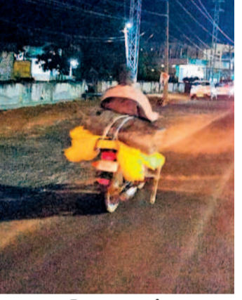
ములుగు: ట్రైక్లపై టార్నాల్స్ తీసుకెళ్తున్న రైతు

యూనంగి వరినాట్లు ప్రారంభించారు. చాలా వరకు రైతులు ధాన్యంలో తేమశాతం రాక, సకాలంలో ధాన్యం ఉబ్బులు అండక, వర్షాల భయంతో పైవే కొనుగోలు కేంద్రాల్లో వడ్ల నిల్వలు పేరుకుపోతున్నాయి. వాతావరణం చల్లబడడంతో మూయిశ్రత రాక అరిగిన వదుతున్నారు. ఓ పక్క మూయిశ్రత రాక... మరోపక్క అకాల వర్షాలు ఆగం చేస్తున్నాయి. కేంద్రాల్లో అధికారులు ఇప్పటి వరకు 41.75 మెట్రిక్ టన్నుల ధాన్యం మాత్రమే కొనుగోలు చేశారు. ఇంకా 1.59 లక్షల మెట్రిక్ టన్నుల ధాన్యాన్ని కొనాల్సి ఉన్నది.