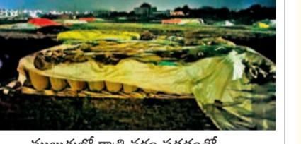
ములుగులో రాత్రి వర్షం పడడంతో ధాన్యపు టార్నాల్స్ పై టార్నాల్స్ కప్పిన రైతులు

రులు స్పందించి రైతులకు టార్నాల్స్, గన్నీ బ్యాగులను అందించిన సకాలంలో ధాన్యం మిల్లులకు తరలివాలని కోరుతున్నారు.