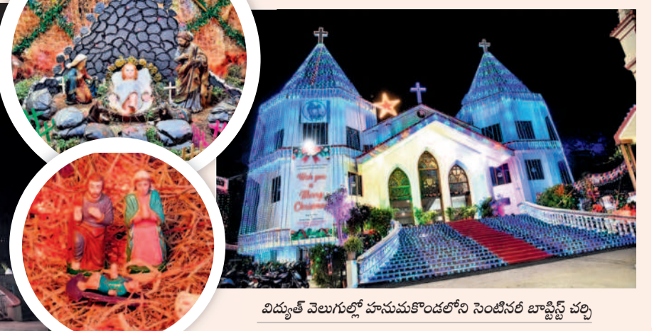
విద్యుత్ వెలుగులో హనుమకొండలోని సెంటినెల్ బాప్టిస్ట్ చర్చి