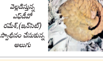
రమేశ్ (ఇన్సెక్ట్) స్వాధీనం చేసుకున్న అలుగు