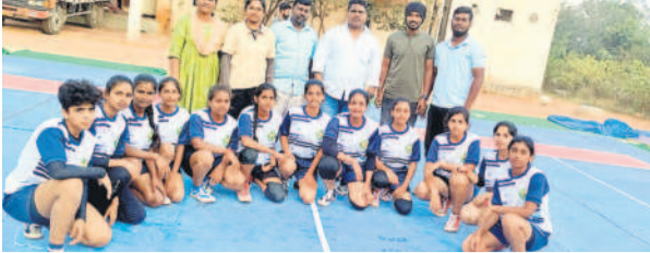
రాష్ట్ర స్థాయిలో గెలుపొందిన యాదాద్రి భువనగిరి జిల్లా బాలికల కబడ్డీ జట్టు

ఆరేటూర్ టౌన్, డిసెంబర్ 23 : హైదరాబాద్ లోని హాకీమేట్ స్పోర్ట్స్ హాల్ లో ఈ నెల 22 నుంచి 25 వరకు జరిగిన రాష్ట్ర స్థాయి బాలికల కబడ్డీ పోటీల్లో యాదాద్రి జిల్లా