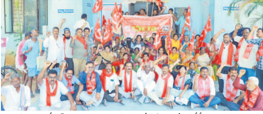
నల్లగొండ తానీయల్ కార్యాలయం ఎదుట అభిదారులతో కలిసి ధర్నా చేస్తున్న సీపీఎం నాయకులు