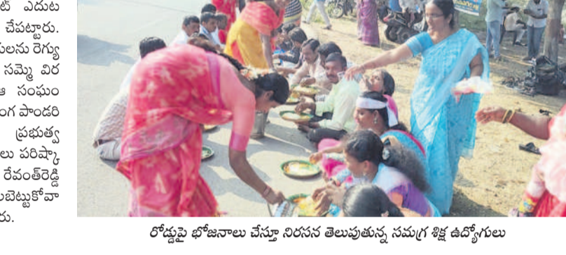
రోడ్డుపై భోజనాలు చేస్తూ నిరసన తెలుపుతున్న సమగ్ర శిక్ష ఉద్యోగులు

భువనగిరి కలెక్టరేట్, డిసెంబర్ 23 : సమగ్ర శిక్ష ఉద్యోగులను సమగ్ర శిక్ష ఉద్యోగులను రెగ్యులర్ చేసుకోవడానికి సర్కారు ఆంక్షలు విధించింది. వంటావార్చు చేస్తున్నారు. సమగ్ర శిక్ష ఉద్యోగులను రెగ్యులర్ చేసే వరకు సమగ్ర శిక్ష ఉద్యోగులకు ముగ్గుల పొందరే కాదు. ఆంక్షలు విధించడంతో భిక్షులను చేసి నిరసన తెలిపారు. సూర్యపేటలో సీఎం, మంత్రిల పేర్లు మార్చేటట్లు ఉన్న వారి నుంచి భిక్షులను చేశారు. యాదాద్రి