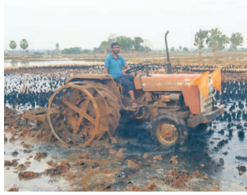
మర్రికాలో దుక్కు దున్నుతున్న రైతు

సూర్యపేట, డిసెంబర్ 23 (నమస్తే తెలంగాణ) : వానకాలం ధాన్యం విక్రయాలను పూర్తి చేసుకున్న రైతాంగం ఇప్పుడు పూడి యాసంగి సీజన్ కు సిద్ధమవుతున్నది. దుక్కులు దున్నుతూ నాట్లు వేయడం మొదలు పెడుతున్నది. ఈసారి సూర్యపేట జిల్లావ్యాప్తంగా 5,02,372 ఎకరాల్లో వివిధ పంటలను సాగు చేయనున్నట్లు వ్యవసాయాధికారులు అంచనా వేశారు. ఆయా పంటలకు అవసరమైన మిక్చరాలు, ఎరువులను సీద్లను చేస్తున్నట్లు ప్రకటించారు. కాగా, ఏడాది క్రితం వరకు గత