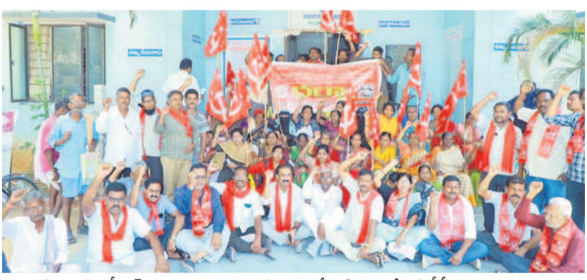
నల్లగొండ తానీర్ల కార్యాలయం ఎదుట అభివృద్ధి కలిసి ధర్నా చేస్తున్న సీపీఎం నాయకులు