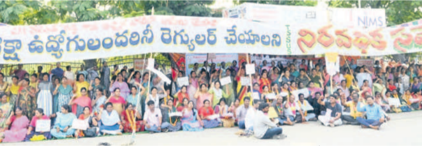
సమగ్ర శిక్ష ఉద్యోగులందరినీ రెన్యూవల్ చేయాలని నిరసన

రామగిరి, డిసెంబర్ 23: సమగ్ర శిక్ష ఉద్యోగులు చేస్తున్న డిక్షన్లో భాగంగా సోమవారం ఉమ్మడి నల్లగొండ జిల్లావ్యాప్తంగా అన్ని జిల్లా కేంద్రాల్లో నిరసనలు కొనసాగాయి. నల్లగొండలో భిక్షాటన చేసే నిరసన తెలిపారు. సూర్యాపేటలో సీఎం, మంత్రుల పేర్ల మాస్కెట్లకు ఉన్న వారి నుంచి భిక్షాటన