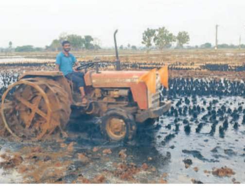
మర్రిచాలలో దుక్కు దున్నుతున్న రైతు

సూర్యాపేట, డిసెంబర్ 23 (సమస్తి తెలంగాణ) : వానకాలం ధాన్యం విక్రయాలను పూర్తి చేసుకున్న రైతాంగం ఇప్పుడు పంట దేవుడిని పూజించి సీజన్ కు సిద్ధమవుతున్నది. దుక్కులు దున్నుతూ నాట్లు వేయడం మొదలు పెడుతున్నది. ఈసారి సూర్యాపేట జిల్లావ్యాప్తంగా 5,02,372 ఎకరాల్లో వివిధ పంటలను సాగు చేయనున్నట్లు వ్యవసాయాధికారులు అంచనా వేశారు. ఆయా పంటలకు అవసరమైన విత్తనాలు, ఎరువులను సిద్ధం చేస్తున్నట్లు ప్రకటించారు. కాగా, ఏడాది క్రితం వరకు గత బీఆర్ఎస్ ప్రభుత్వం రైతులకు ఏటా నాలుగు సీజన్లకు రైతులకు పేరిట ఒక రాకు రూ.5వేల చొప్పున పెట్టుబడి సాయం అందించేది. కాంగ్రెస్ పాలనలో రైతులకు పెట్టుబడి సాయం అందడం ద్రాక్ష అయ్యింది. రైతుభరోసా పేరిట ఒకరాకు రూ.7,500 చొప్పున ఇస్తామని ఇచ్చిన హామీని ఈ యాసంగిలో గిల్లేనా అమలు చేస్తారా, లేదా అన్నది రైతులను వేదీకరిస్తున్నది. పదకొండేండ్ల క్రితం వరకూ సూర్యాపేట జిల్లా పరిధిలోని సగం భూములు