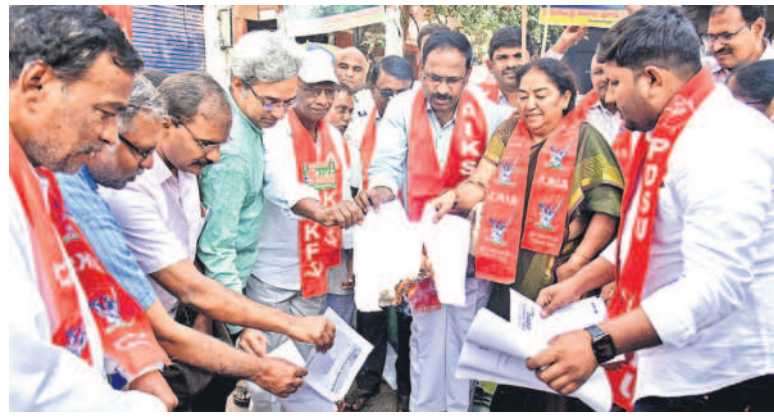
సంయుక్త కిసాన్ మోర్చా జాతీయ కమిటీ పలువురు మేరకు అర్జీని ఎక్స్. రోడ్డులో మార్కెట్ పాలిస్ పత్రాలను ధనం చిన్ననైకు సంఘం నాయకులు

I హైదరాబాద్, మంగళవారం 24 డిసెంబర్ 2024 HYDERABAD