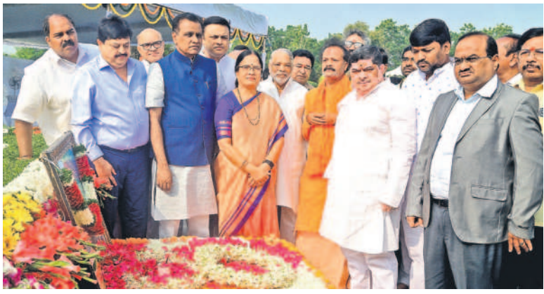
పీఠ నిర్మాణం రాష్ట్ర వర్తక సంఘం, గాంధీ నగర్ లోని పీఠ భూమి వద్ద నివాళులర్పిస్తున్న మంత్రి పాపన్నం ప్రభాకర్ గౌడ్, ఎమ్మెల్యే వాణిపతి తదితరులు