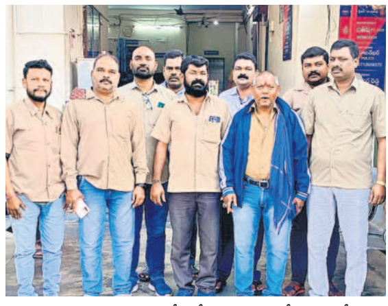
మంచీరాల జిల్లా మండలంలో పోలీసులు అదుపులో ఉన్న ఆటో డ్రైవర్లు