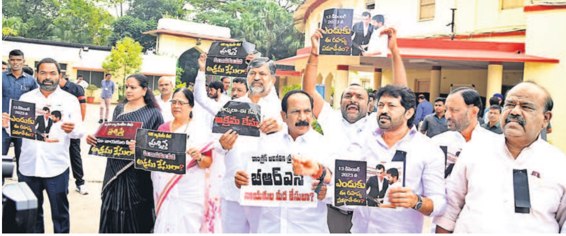
బీఆర్ఎస్ నేతలపై అక్రమ కేసులను తప్పబడుతూ శాసనసభలో ఎదుట నిరసన వ్యక్తంచేస్తున్న ఎమ్మెల్యేలు