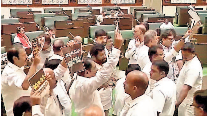
ఈ రేపిస్తే చర్చకు పట్టుబడుతూ శాసనసభలో స్పీకర్ పోడియం ఎదుట ప్రదర్శనలు చేసిన బీఆర్ఎస్ ఎమ్మెల్యేలు