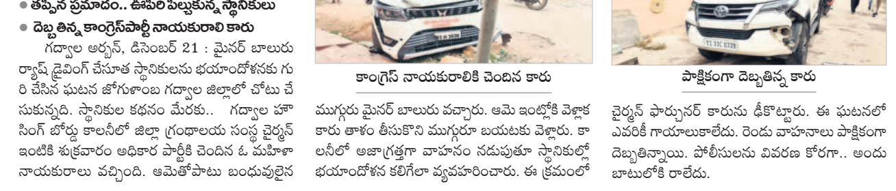
కాంగ్రెస్ నాయకులారితో చెందిన కారు

ముగ్గురు మైనర్ బాలురు వచ్చారు. ఆమె అంబ్లీకి వెళ్లాలని తాళం తీసుకొని ముగ్గురు బయటకు వెళ్లారు. కాలనీలో అజాగ్రతగా వాహనం నడుచుతూ స్టానికల్లో భయాందోళన కలిగి వ్యవహరించారు. ఈ క్రమంలో