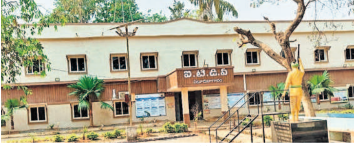
ఏటూరునగరంలోని ఐటీడీఎస్ కాల్యాటం

ఐటీడీఎస్ పాలకమండలి సమావేశం నిర్వహణపై అధికార యంత్రాంగం తీవ్ర నిర్లక్ష్యం కనబరుస్తున్నది. వ్యావహారిక ప్రతి మూడు నెలల కోసాని నిర్వహించాల్సి ఉండగా ఐడీఎస్ దాటిగా దాని ఉసి ఎక్కడం లేదు. సమస్యలు, సంక్షేమ పథకాలపై చర్చ జరిగితే నిధులు కేటాయింపు అవకాశం ఎక్కువగా ఉంటుంది. కానీ 2019 డిసెంబర్ 20న నిర్వహించిన 60వ పాలక మండలి సమావేశం చివరిదిగా మిగిలిపోయింది. దీంతో గిరిజన సంక్షేమంపై నీలిగిరి కమిషన్లు అభివృద్ధి ముందుకు సాగడం లేదు. సర్టిఫైడ్ పథకాలు అర్జులకు అందకుండా వెళ్లి రిస్తున్నాయి. ఇప్పటికైనా ఐటీడీఎస్ పాలకమండలి సమావేశం నిర్వహించి తమ సమస్యలు పరిష్కరించాలని అడవి బిడ్డలు కోరుతున్నారు.