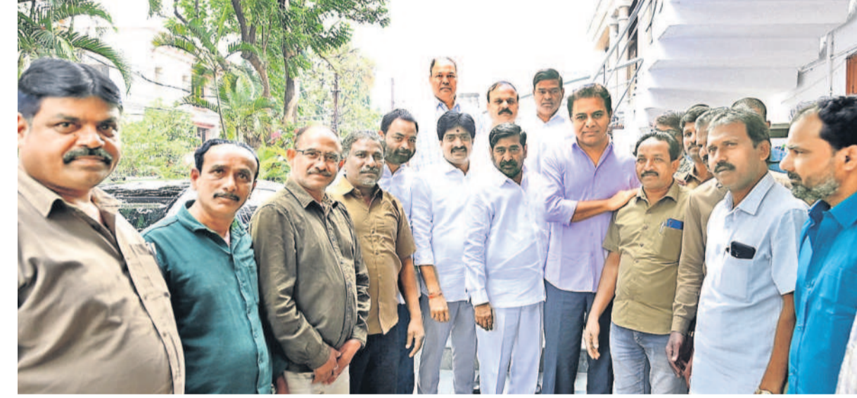
అలంపూర్ చౌరస్తా, డిసెంబర్ 20 : హైదరాబాద్ లో బీఆర్ఎస్ వర్కింగ్ ప్రెసిడెంట్ కేటీఆర్ ను ఆటోవాలాలు మర్యాదపూర్వకంగా కలిశారు. శుక్రవారం అలంపూర్ ఎమ్మెల్యే విజయమతో కలిసి తమ వజ్రాస కాంగ్రెస్ ప్రభుత్వంతో కొట్లాడుతున్నందుకు ఆటో డ్రైవర్లు కృతజ్ఞతలు తెలిపారు. ఇప్పటికే 100 మందికిపైగా ఆటో డ్రైవర్ల ఆత్మహత్యలు చేసుకున్నారు, ఇకపై ఎవరూ అలాంటి పనులు చేయద్దని భరోసానిచ్చారు. మీ సమస్యలపై పోరాటం చేసేందుకు సిద్ధంగా ఉన్నామని కేటీఆర్ హామీ ఇచ్చారు.

నమస్తే నెట్వర్క్ డిసెంబర్ 20 : సమస్యల పరిష్కారం కోసం చలో అసెంబ్లీ బయలుదేరి ఆటో యజమానులు, డ్రైవర్లను శుక్రవారం పోలీసులు అరెస్ట్ చేశారు. ఉమ్మడి కరీంనగర్ జిల్లా వ్యాప్తంగా హైదరాబాద్ కు వెళ్తున్న ఆటో కార్మికులను ముందస్తుగా అదుపులోకి తీసుకుని లాఠాకు తరలించారు.