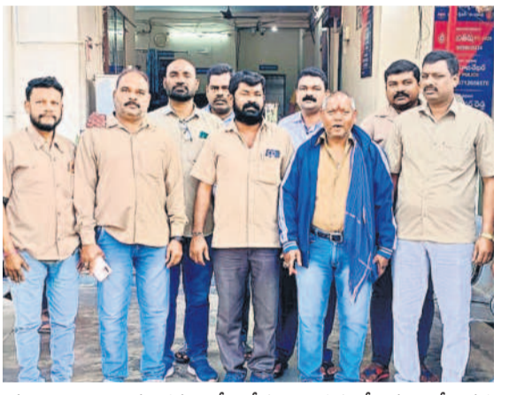
మంచిర్యాల జిల్లా మండలంలో పోలీసులు అదుపులో ఉన్న ఆటో డ్రైవర్లు