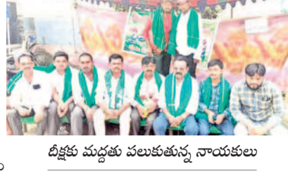
దీక్షకు మద్దతు పలుకుతున్న నాయకులు