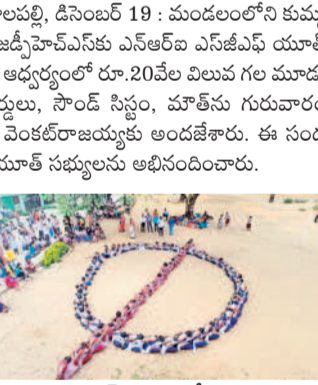
గణిత సింబల్ ఆకారంలో పిల్లలు