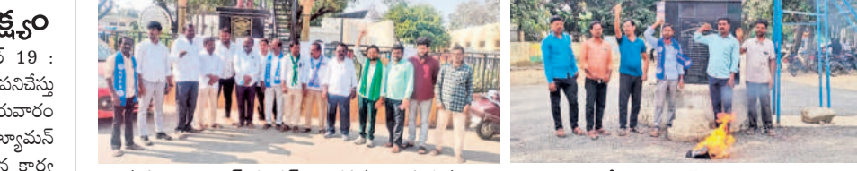
మహబూబాబాద్ రూరల్ : నిరసన తెలుపుతున్న దేశీయ గిరిజన ప్రజాసంఘాల నాయకులు