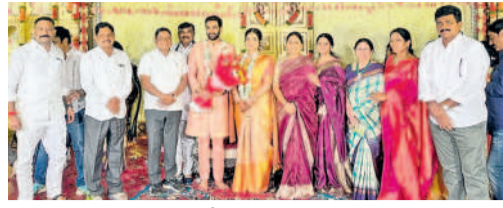
అభ్యుదయిస్తున్న మాజీ ఎంపీ కవిత, మాజీ ఎమ్మెల్యే రెడ్డానాయక్