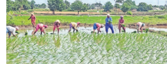
పెరికసింగారంలో సాగర్ కాల్వ కింద యాసంగి నాట్లు వేస్తున్న కూలీలు

కూసుమంచి, డిసెంబర్ 19 : సాగర్ ఆయకట్టు పరిధిలో యాసంగి సాగుకు నీటి విడుదల షెడ్యూల్ను నీటిపారుదల శాఖ అధికారులు ఖరారు చేశారు. వారబంది పద్ధతిలో వారానికి ఒకసారి ఆన్, ఆఫ్ పద్ధతిలో నీరు ఇవ్వాలని నిర్ణయించారు. అధికారికంగా ఆరుతడి పంటలకే నీరు అని ప్రకటిస్తున్నారు. సాగర్ ఆయకట్టు కింద ఉన్న 17 మండలాల్లో 2.54 లక్ష ఎకరాలకు నీటిని విడుదల చేయనున్నారు. కార్షన్ సాగర్ నుంచి యాసంగి సాగు కోసం అధికారులు కుట్రాజ్ఞా జలాలును ఈ నెల 15న వదలడంతో మంగళవారం ఆ నీరు పాలేరు జలాశయానికి చేరింది. ఇప్పటికే నీటిని జిల్లాకు ఇస్తుండడంతో ఈనాటి నీటి