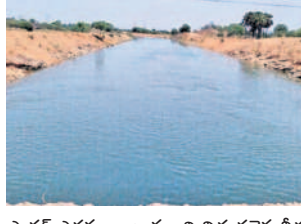
సాగర్ ఎడమ కాల్వ నుంచి విడుదలైన నీరు