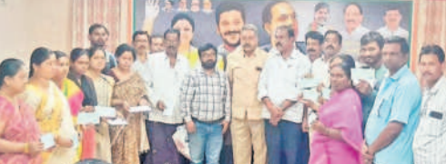
లబ్ధిదారులకు కళ్యాణలక్ష్మి చెక్కులు అందజేస్తున్న అధికారులు