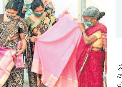
కరోనా సమయంలోనూ బతుకమ్మ వీరలు అందుకొని మురిసిపోతున్న మహిళలు (ఫైల్)

సమైక్య రాష్ట్రంలో నిర్వహణలో గురైన బతుకమ్మకు తెలంగాణను తెచ్చిన కేసీఆర్ పూర్వ వైభవం కల్పించారు. తెలంగాణ సంస్కృతి సంప్రదాయాలను రాష్ట్ర ప్రజలందరూ గౌరవించుకునేలా వేడుకలు నిర్వహించారు. తొమ్మిది రోజులపాటు తెలంగాణ ఆడబిడ్డలందరూ సంతోషంగా బతుకమ్మలు ఆడేలా ఏర్పాట్లు చేసి వసతులు కల్పించేవారు. మధ్యాహ్నం తరువాత వెళ్లి బతుకమ్మ ఆడుకునేందుకు వీలుగా మహిళా ఉద్యోగలకు వెనుకబాటు కల్పించేవారు. కుల, మత తారతమ్యాల లేకుండా 18 ఏళ్ల నిండి రేపన్న కార్మిళ్ల పేరున్న ప్రతి ఆడబిడ్డకూ పండుగకు పది, పదిహేను రోజుల ముందుగానే బతుకమ్మ వీరలు పంపిణీ చేసేవారు. తెలంగాణ అమెరికాను తరువాత మొదలైన ఈ బతుకమ్మ వీరల పంపిణీ నిరుదేశ్వరకా నిరాటంకంగా కొనసాగింది. రకరకాల రంగులు, నాణ్యమైన వీరలు అందుకున్న ఆడబిడ్డలు వాటిని ధరించి సంతోషంగా బతుకమ్మలు ఆడేవారు. ఖమ్మం జిల్లాలో దాదాపు 9 లక్షలకు పైగా బతుకమ్మ వీరలను పంపిణీ చేస్తూ వచ్చింది గత కేసీఆర్ ప్రభుత్వం. రెవెన్యూ శాఖ అధ్యక్షులతో గ్రామాల్లో రేపన్న వీరల ద్వారా వీటిని పంపిణీ చేసింది. కానీ.. ఏడాది క్రితం అధికారంలోకి వచ్చిన రేవంట్ ప్రభుత్వం ఈ ఏడాది బతుకమ్మ వీరల పంపిణీని నిలిపివేసింది. అధికారికంగా నిర్వహించాల్సిన బతుకమ్మ వేడుకలకు మంగళం పాడింది. వైభవాలను చక్కనెట్టి తూతూమంత్రంగా మును అపిసిందింది.