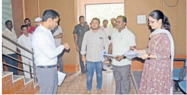
భక్త రామదాసు కళా క్షేత్రాన్ని పరిశీలిస్తున్న కలెక్టర్ ముజమ్మిల్ ఖాన్

ఆధునికీకరణకు డీపీఆర్ తయారు చేయాలి : కలెక్టర్ ముజమ్మిల్ ఖాన్