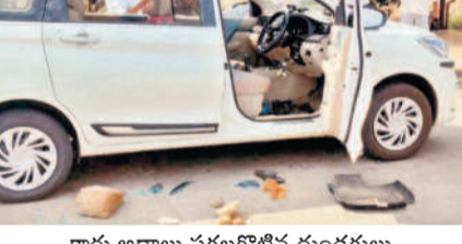
కారు అడ్డాలు పగులగొట్టిన దుండగులు