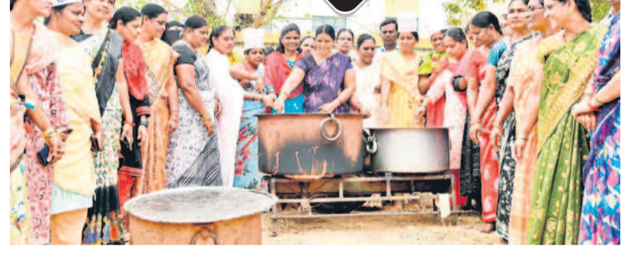
సర్వశిక్షా అభియాన ఉద్యోగులు సమ్మె కొనసాగుతోంది. రోజుకో విభాగం వినుత్తూ లిటిల్ గిర సన తెలియజేస్తున్నారు. బుధవారం మహబూబ్ నగర్ జిల్లా కేంద్రంలోని గ్రామ చాక్ వద్ద మహిళా ఉద్యోగులు మోకాళ్లపై నిలబడడంతోపాటు వంటవాడు, వెంట్రాఫై, వీల బీక్లకు ఉద్యోగి, ఉపాధ్యాయ సంఘాలు సంఘీభావం తెలిపాయి. శ్రమ దోపిడీకి గురవుతున్న ఎన్.ఎస్.ఐ ఉద్యోగులను వెంటనే క్రమబద్ధీకరించి ఉద్యోగ భద్రత కల్పించాలని పలువురు డిమాండ్ చేశాయి.